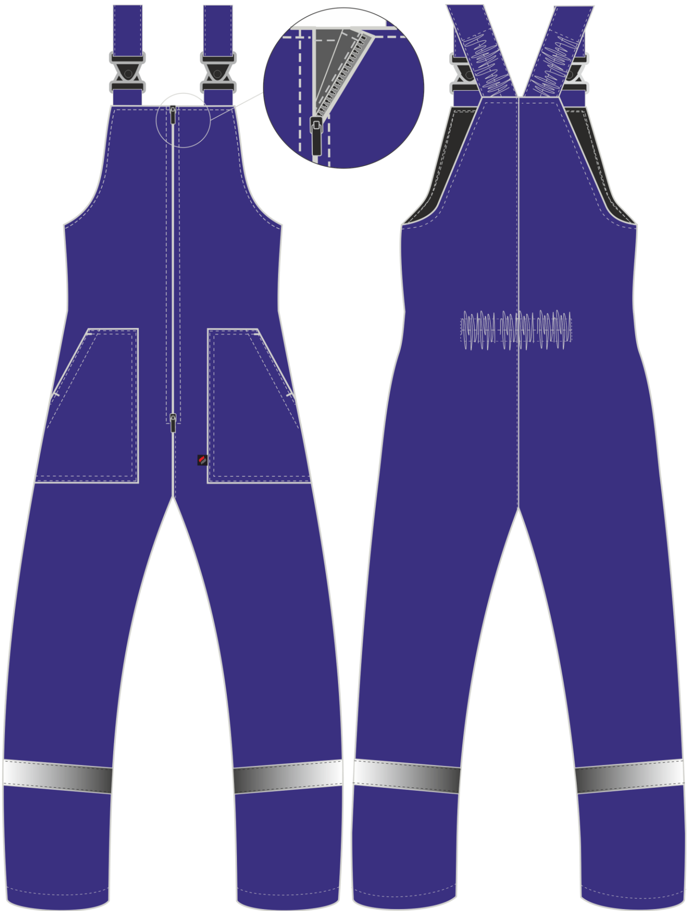
Рис. 1. Эскиз Полукомбинезон зимний Экспертный-Люкс (тк.Смесовая,210), т.синий. Вид спереди и сзади.