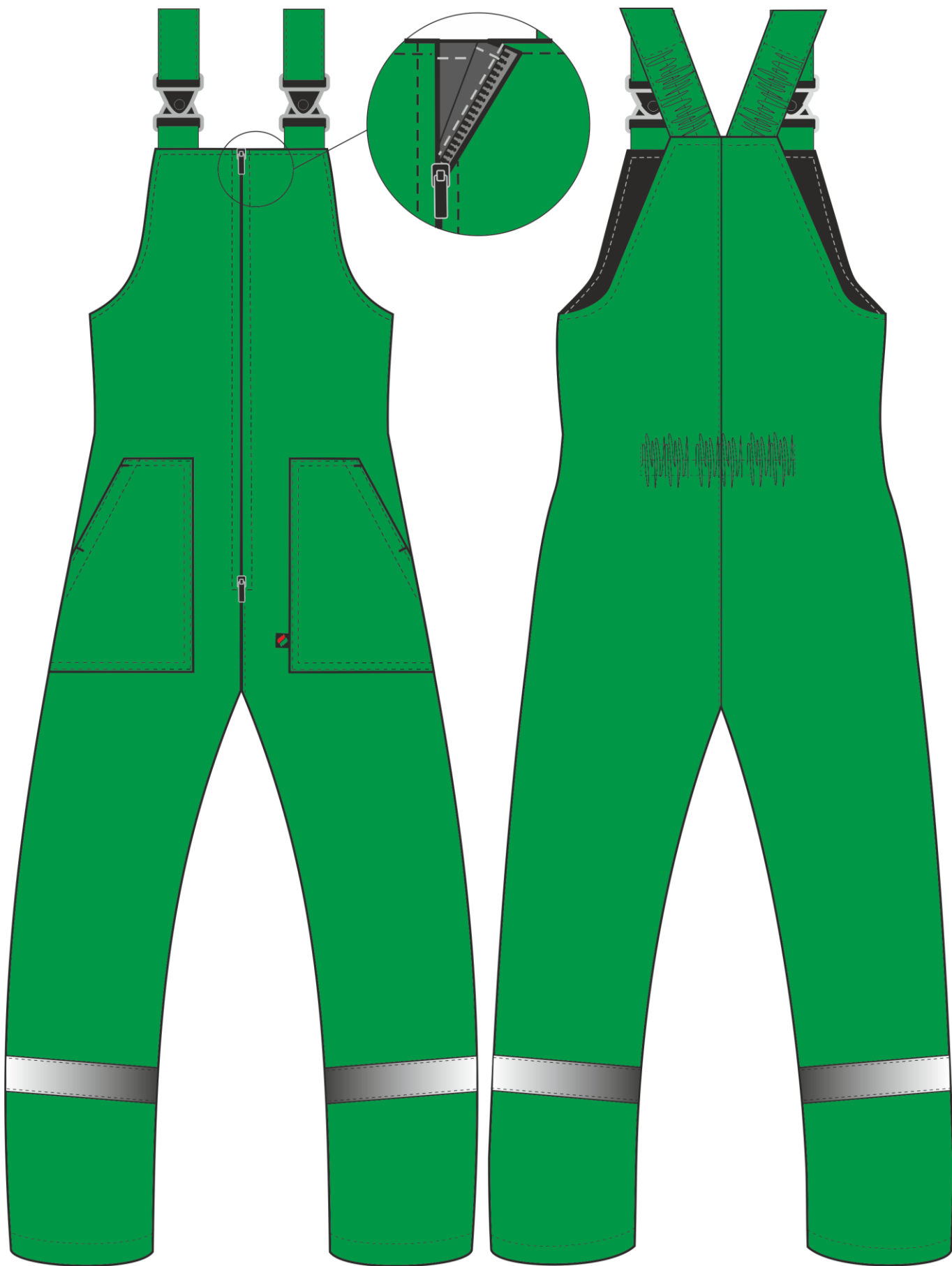
Рис.3. Эскиз Полукомбинезон зимний Экспертный-Люкс (тк.Смесовая,210), зеленый. Вид спереди и сзади.