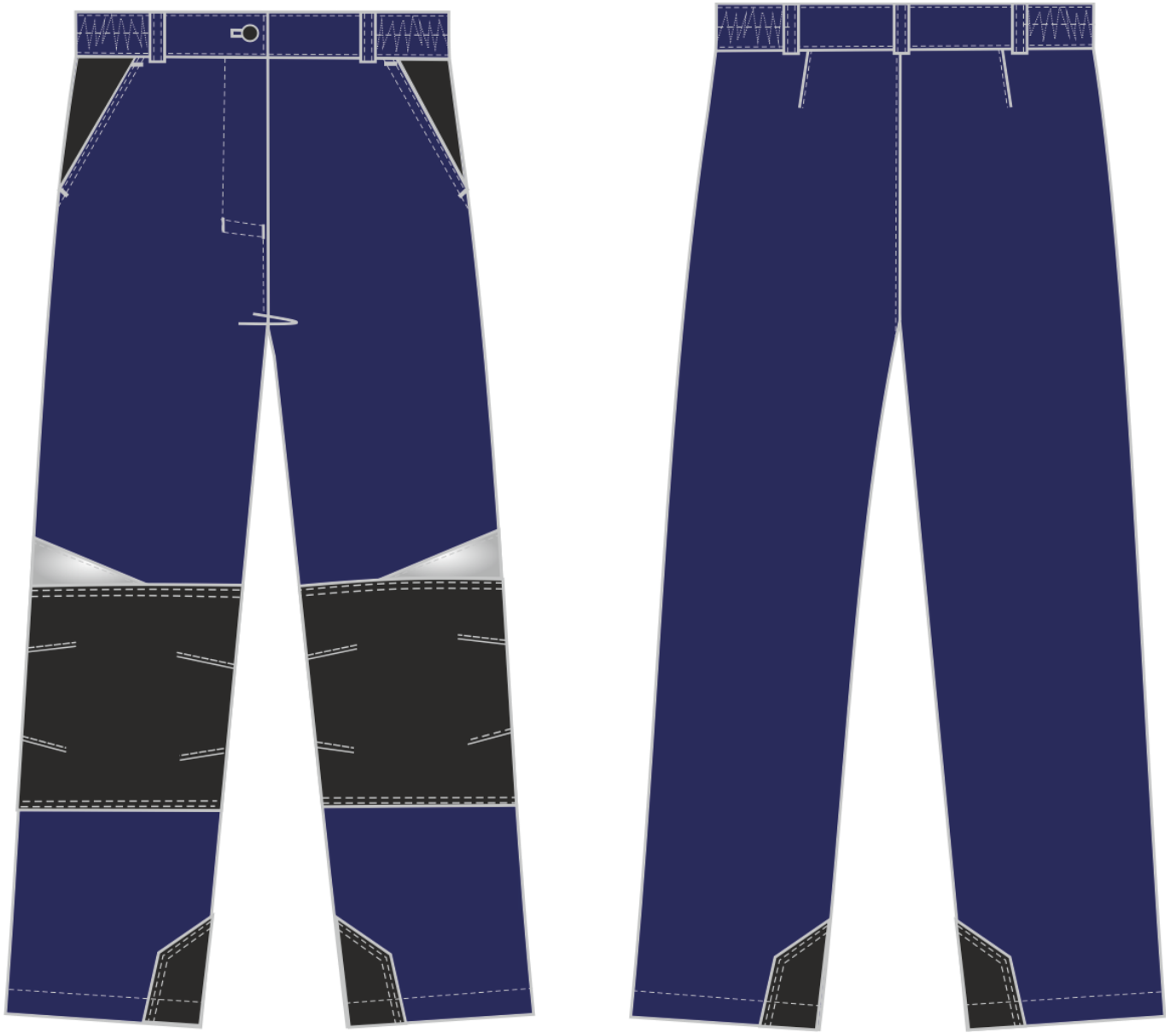
Рис. 6. Эскиз Костюм женский Формула-1 (тк.Смесовая,240) брюки, т.синий/васильковый/черный. Брюки, вид спереди и сзади.