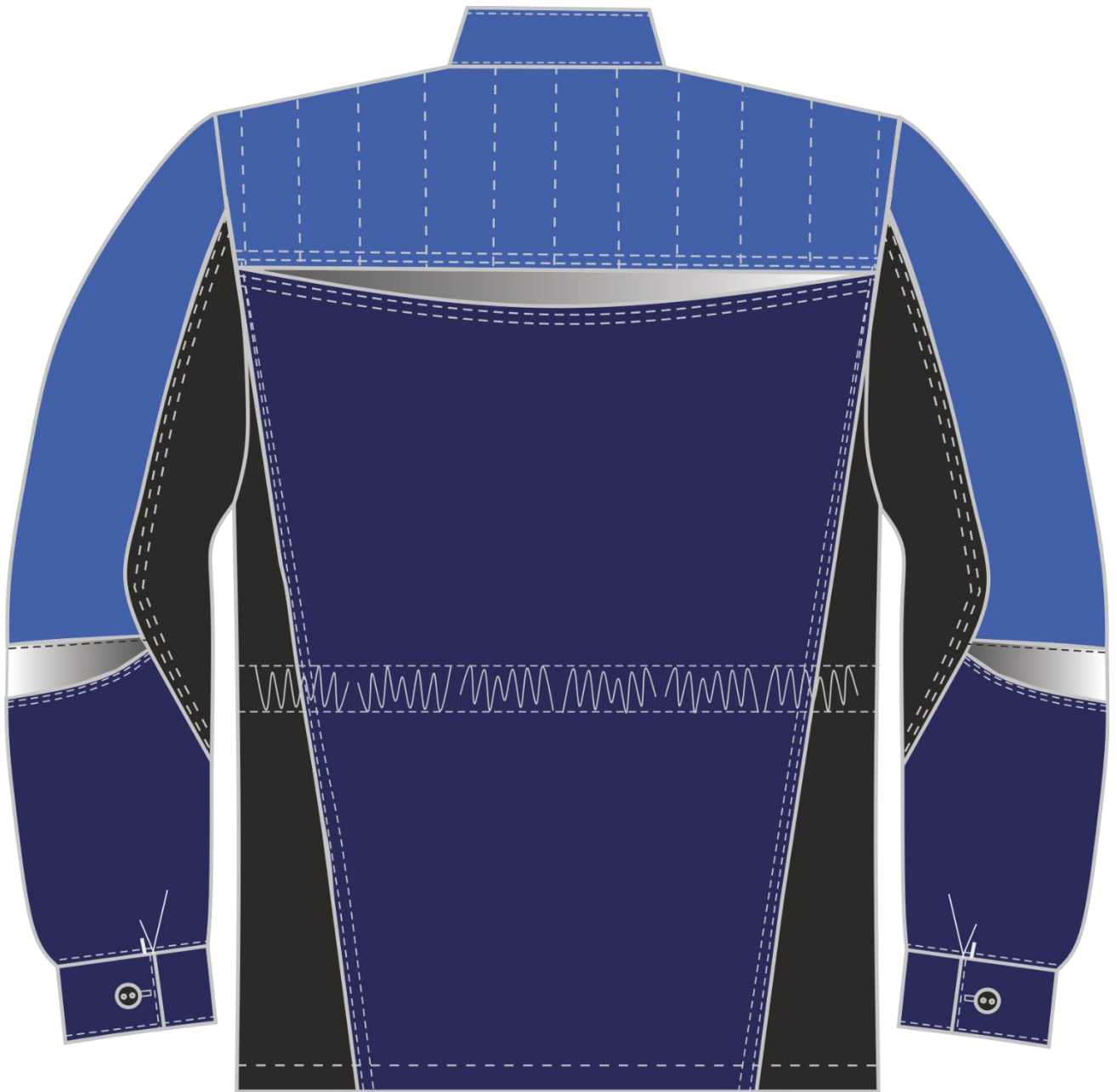
Рис. 4. Эскиз Костюм женский Формула-1 (тк.Смесовая,240) брюки, т.синий/васильковый/черный. Куртка, вид сзади.