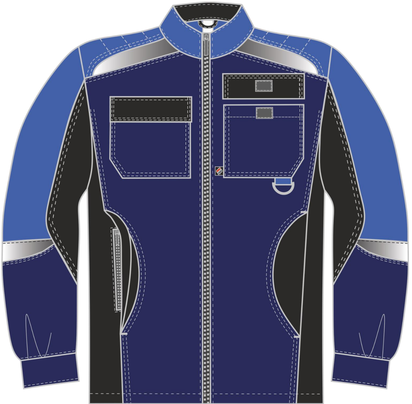
Рис.3.Эскиз Костюм женский Формула-1 (тк.Смесовая,240) брюки, т.синий/васильковый/черный. Куртка, вид спереди.