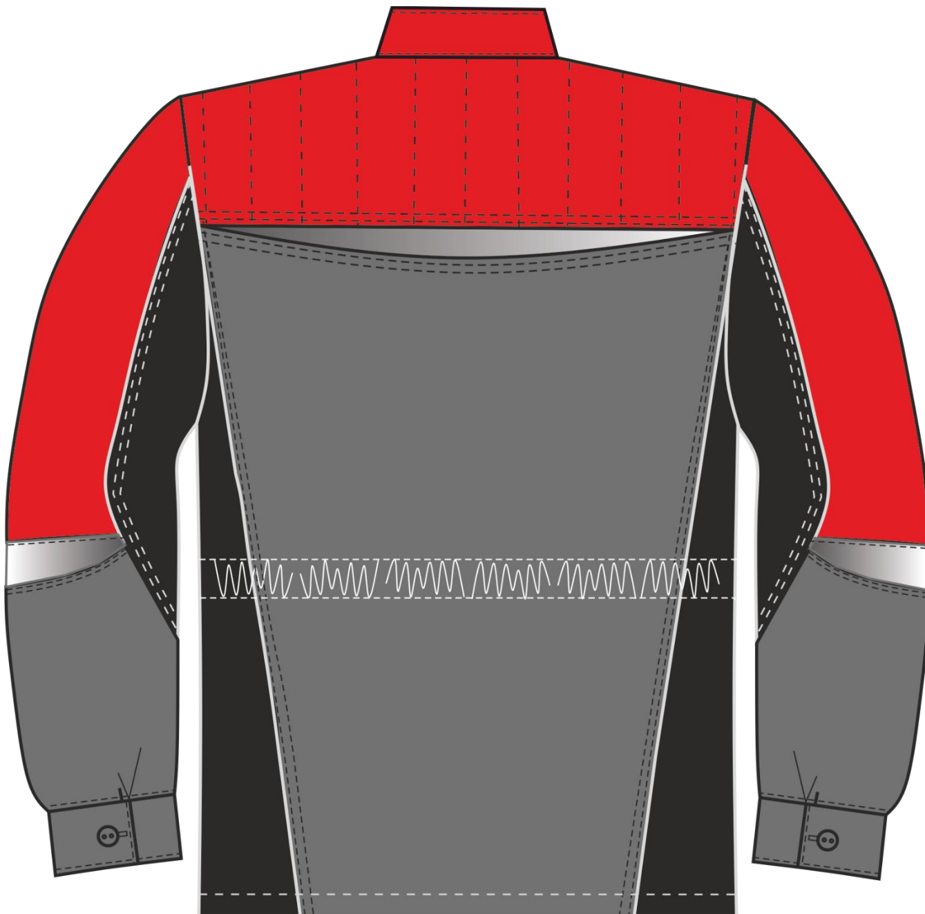
Рис. 2. Эскиз Костюм женский Формула-1 (тк.Смесовая,240) брюки, серый/красный/черный. Куртка, вид сзади.