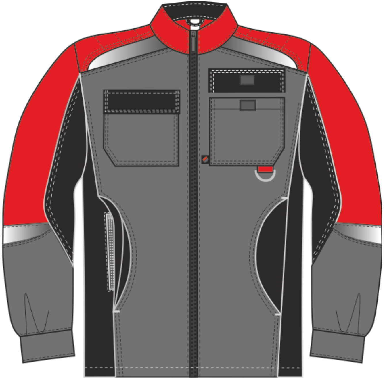
Рис.1.Эскиз Костюм женский Формула-1 (тк.Смесовая,240) брюки, серый/красный/черный. Куртка, вид спереди.