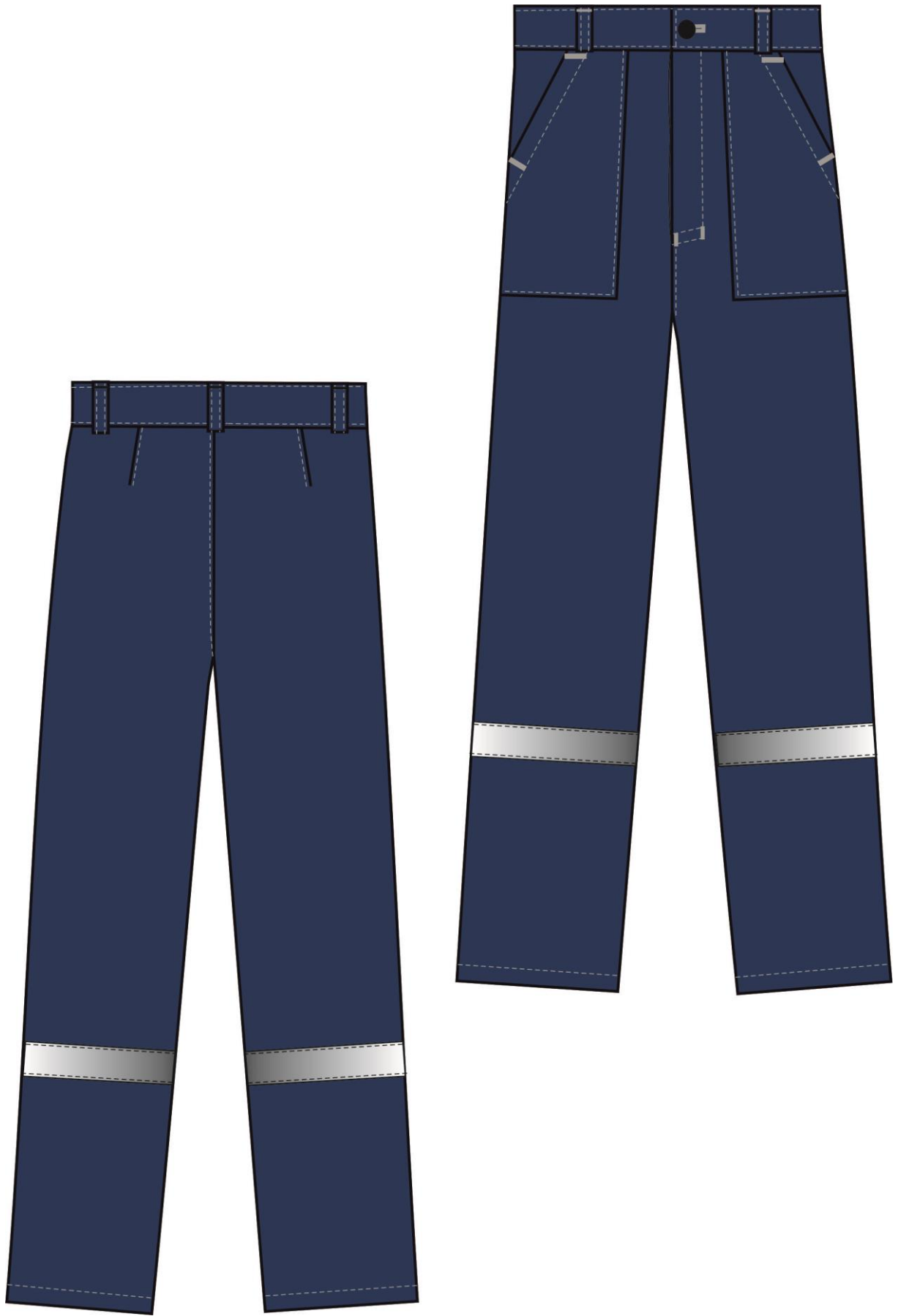
Рис. 4. Эскиз Костюм Стандарт СОП (тк.Смесовая,210) брюки, т.синий/оранжевый, брюки вид спереди и сзади.