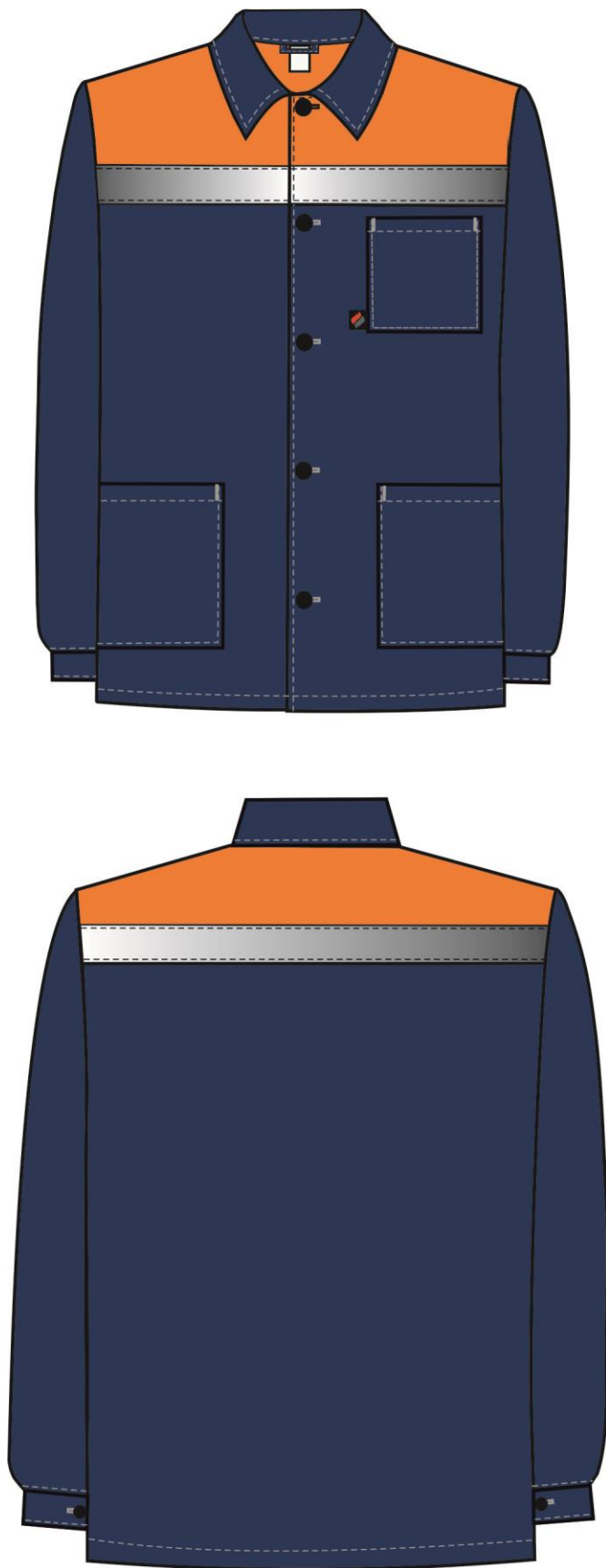
Рис.3. Эскиз Костюм Стандарт СОП (тк.Смесовая,210) брюки, т.синий/оранжевый, куртка вид спереди и сзади.