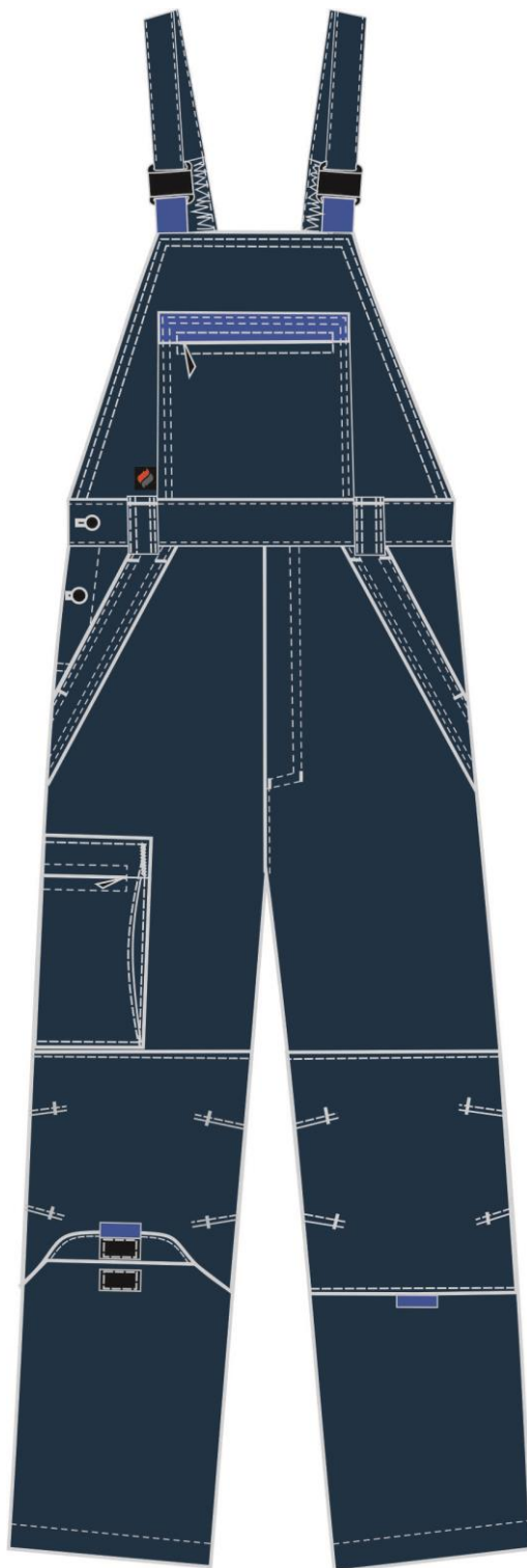
Рис. 1. Эскиз Полукомбинезон Алькор (тк.Карелия,260), т.синий/васильковый. Вид спереди.