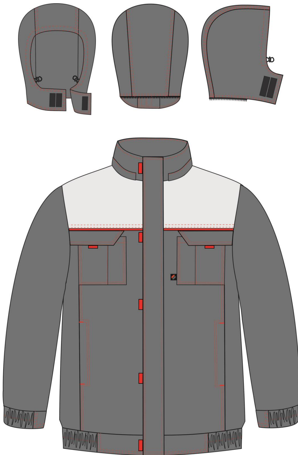
Рис. 1. Эскиз Куртка зимняя укороченная Фаворит NEW (тк.Балтекс,210), вид спереди