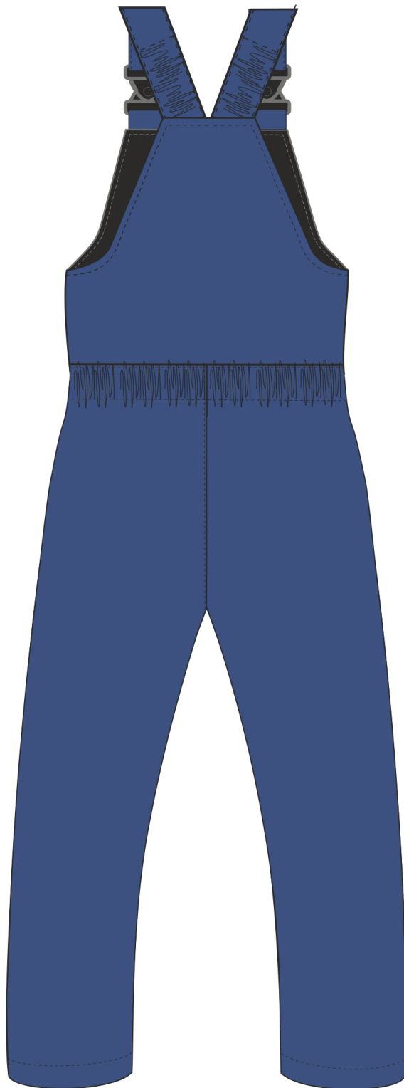
Рис. 2. Эскиз Полукомбинезон зимний женский «Снежана», вид сзади.