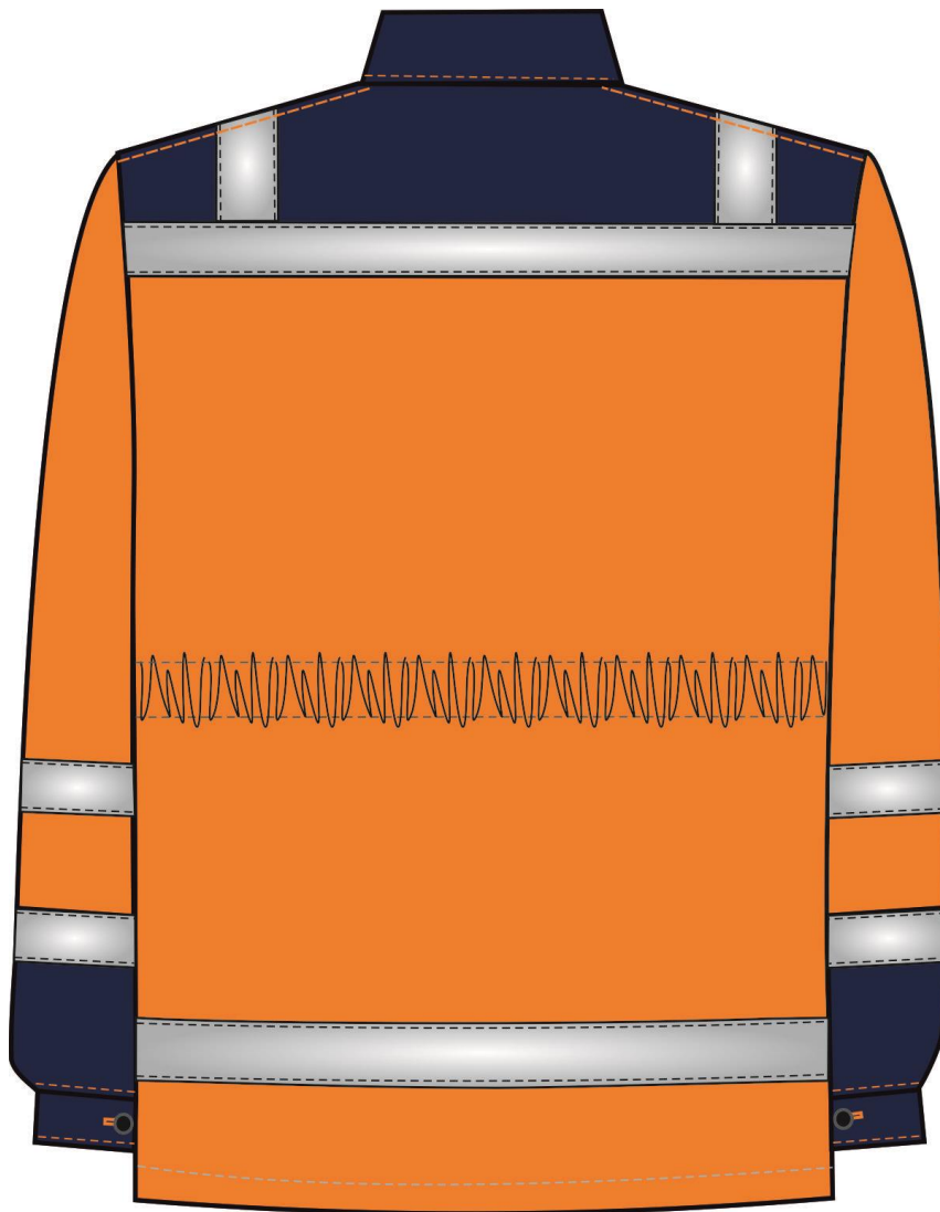
Рис.2. Эскиз Костюм женский Дорожник (тк.Смесовая,210) п/к, оранже- вый/т.синий. Куртка вид сзади.