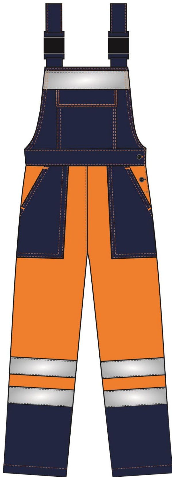
Рис.3. Эскиз Костюм женский Дорожник (тк.Смесовая,210) п/к, оранже- вый/т.синий. Полукомбинезон вид спереди.