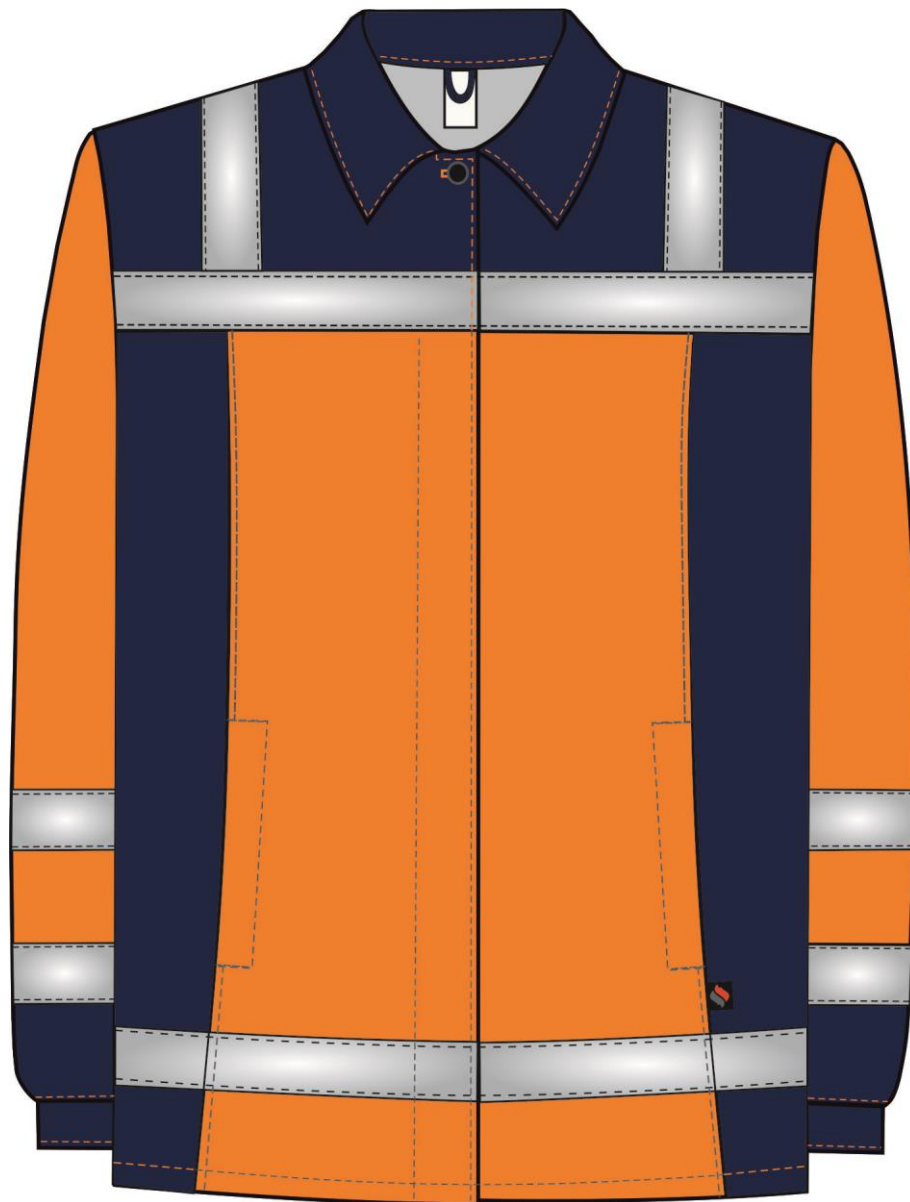
Рис.1. Эскиз Костюм женский Дорожник (тк.Смесовая,210) п/к, оранжевый/т.синий. Куртка вид спереди.