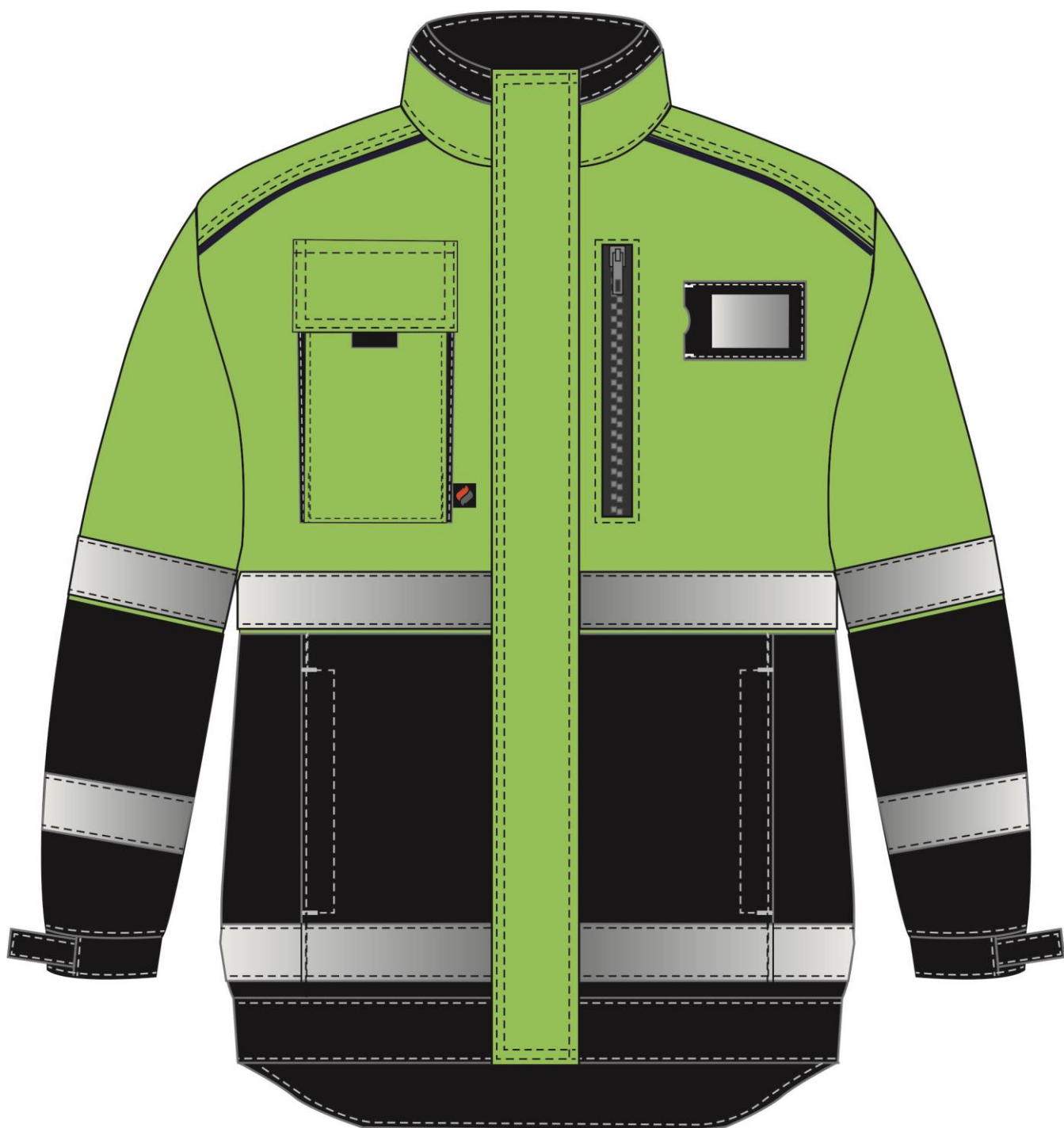
Рис.1. Эскиз Костюм дорожник Сигнал-2 (тк.Балтекс,210) п/к, лимонный/черный Куртка, вид спереди.