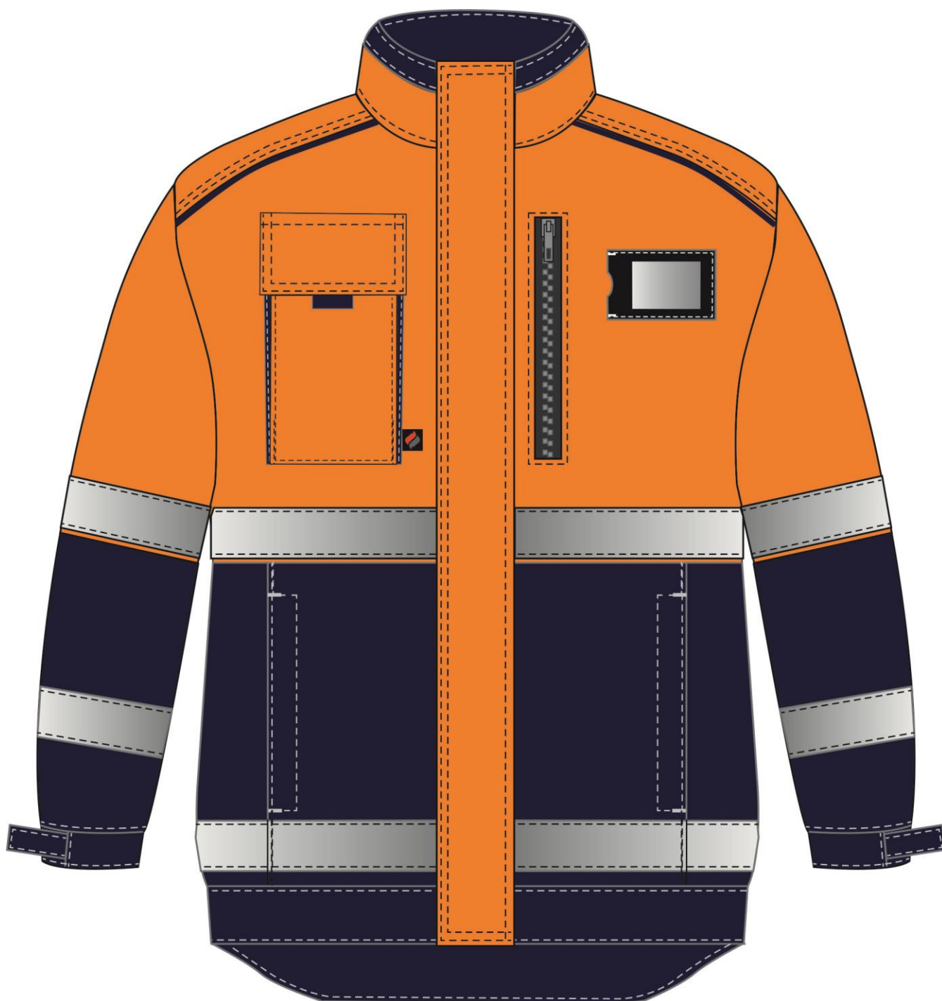
Рис.4. Костюм дорожник Сигнал-2 (тк.Балтекс,210) п/к, оранжевый/т.синий Куртка, вид спереди.