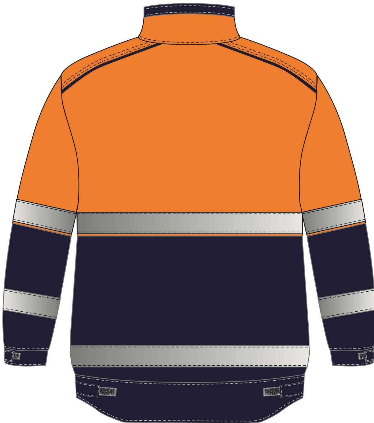
Рис.5. Эскиз Костюм дорожник Сигнал-2 (тк.Балтекс,210) п/к, оранжевый/т.синий Куртка, вид сзади.