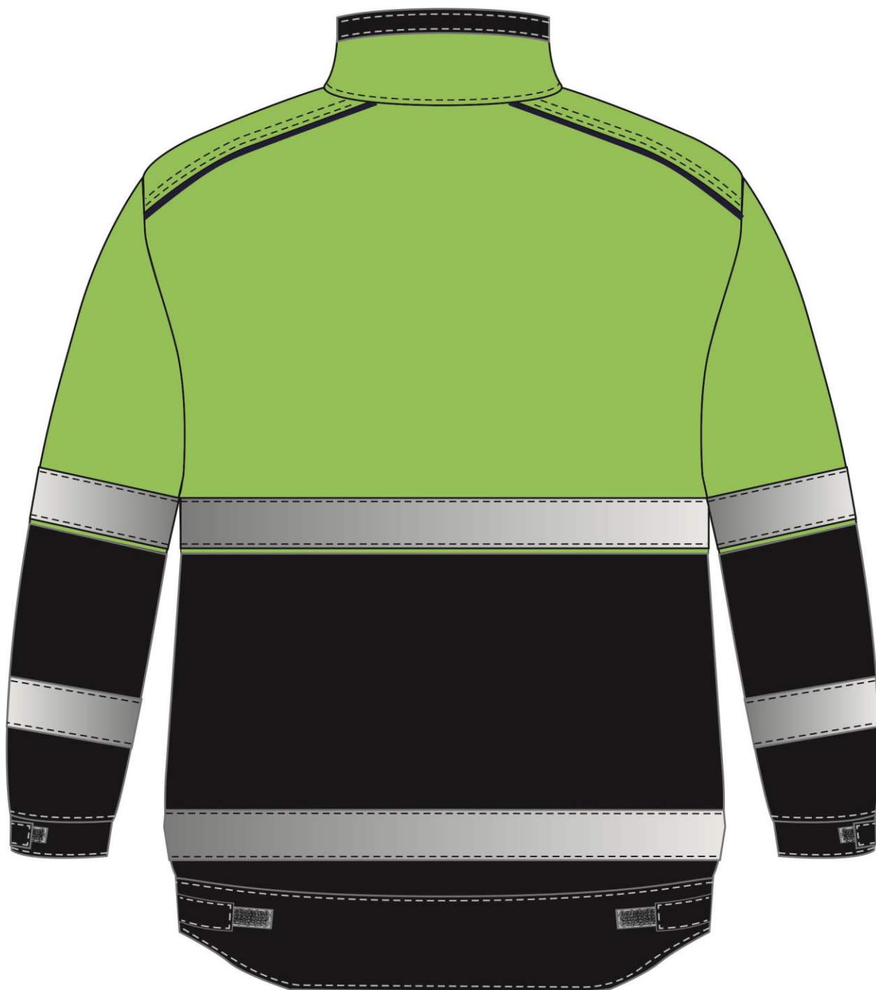
Рис.2. Эскиз Костюм дорожник Сигнал-2 (тк.Балтекс,210) п/к, лимонный/черный Куртка, вид сзади.