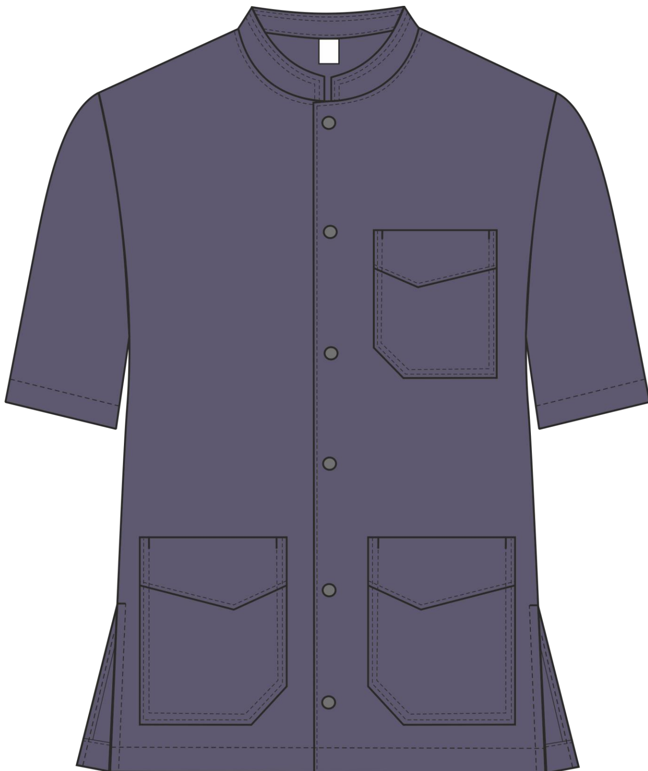
Рис. 1. Эскиз Костюм мужской Сансара-001 (тк.Смесовая,160) MedLine, т.синий, блуза, вид спереди.