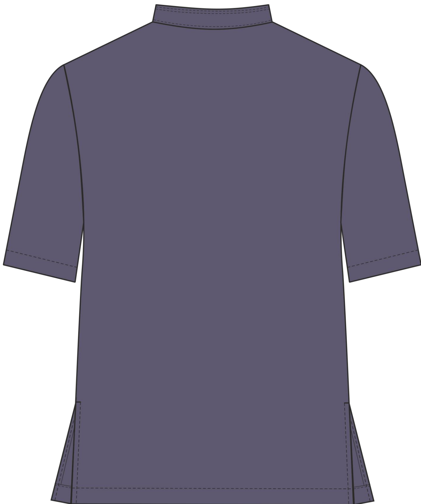
Рис. 2. Эскиз Костюм мужской Сансара-001 (тк.Смесовая,160) MedLine, т.синий, блуза, вид сзади.