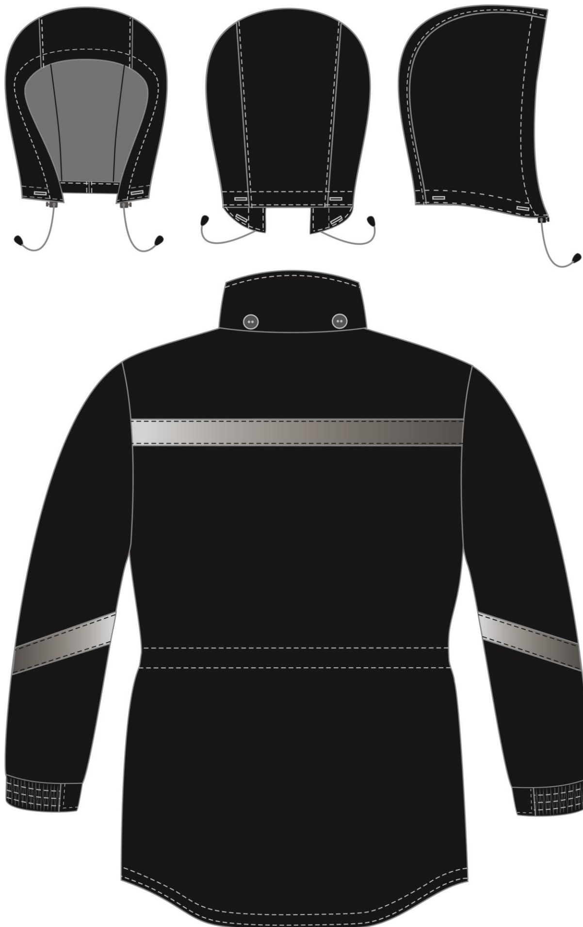
Рис. 6. Эскиз Куртка зимняя Прогресс (тк.Оксфорд), черный. Вид сзади