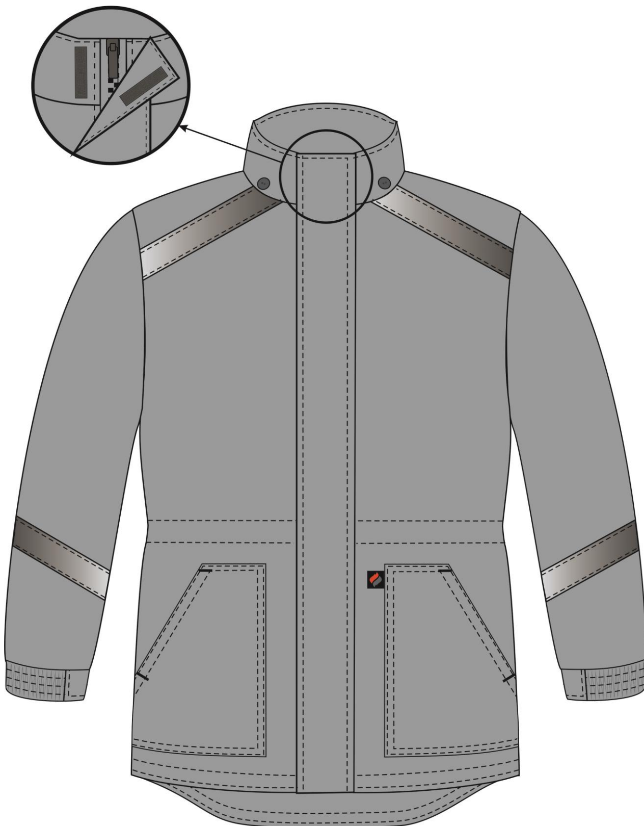
Рис. 3. Эскиз Куртка зимняя Прогресс (тк.Оксфорд), т. серый Вид спереди.