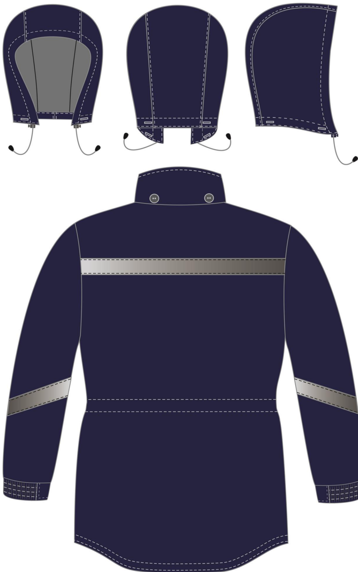
Рис. 2. Эскиз Куртка зимняя Прогресс (тк.Оксфорд), т. синий. Вид сзади