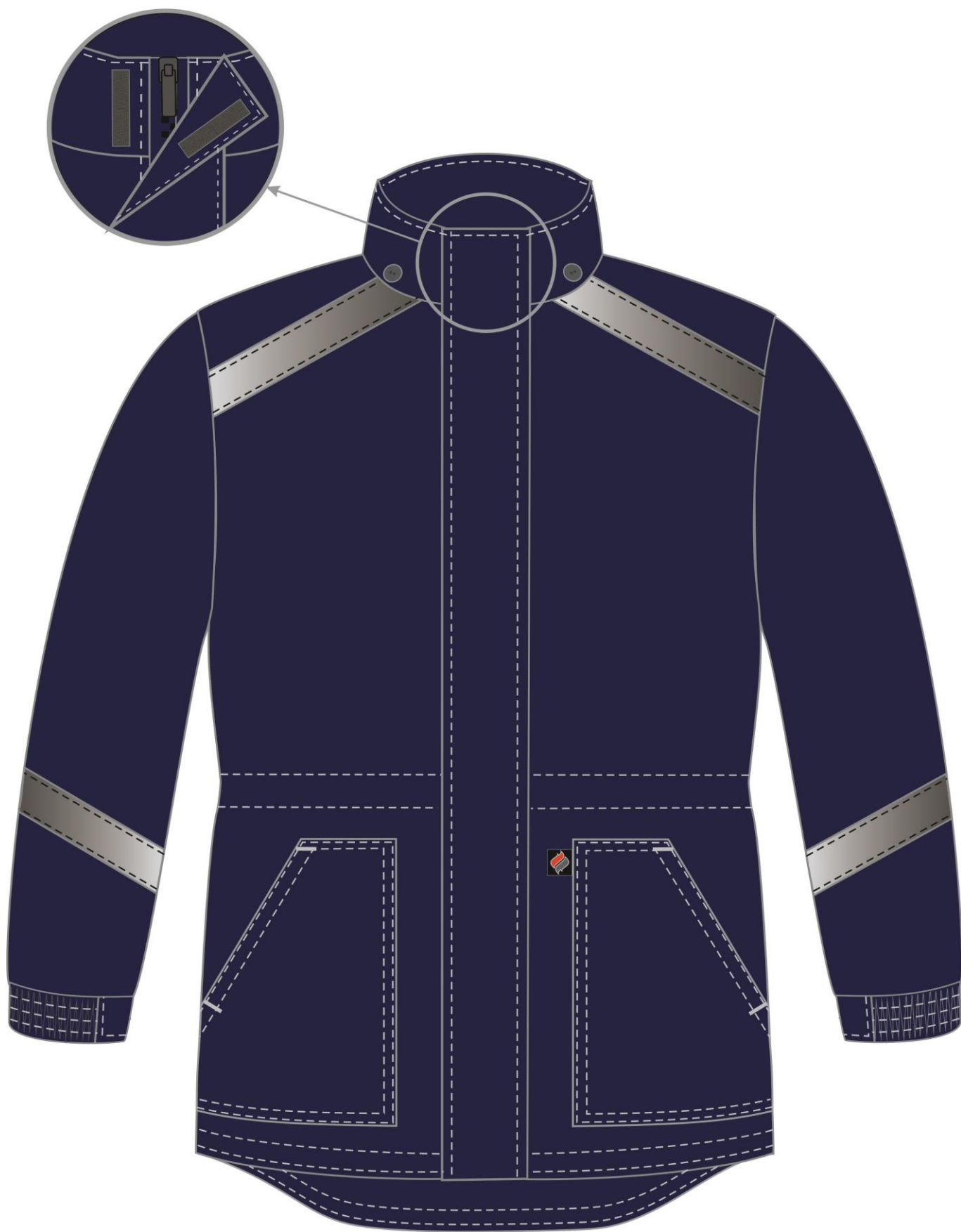
Рис. 1. Эскиз Куртка зимняя Прогресс (тк.Оксфорд), т. синий Вид спереди