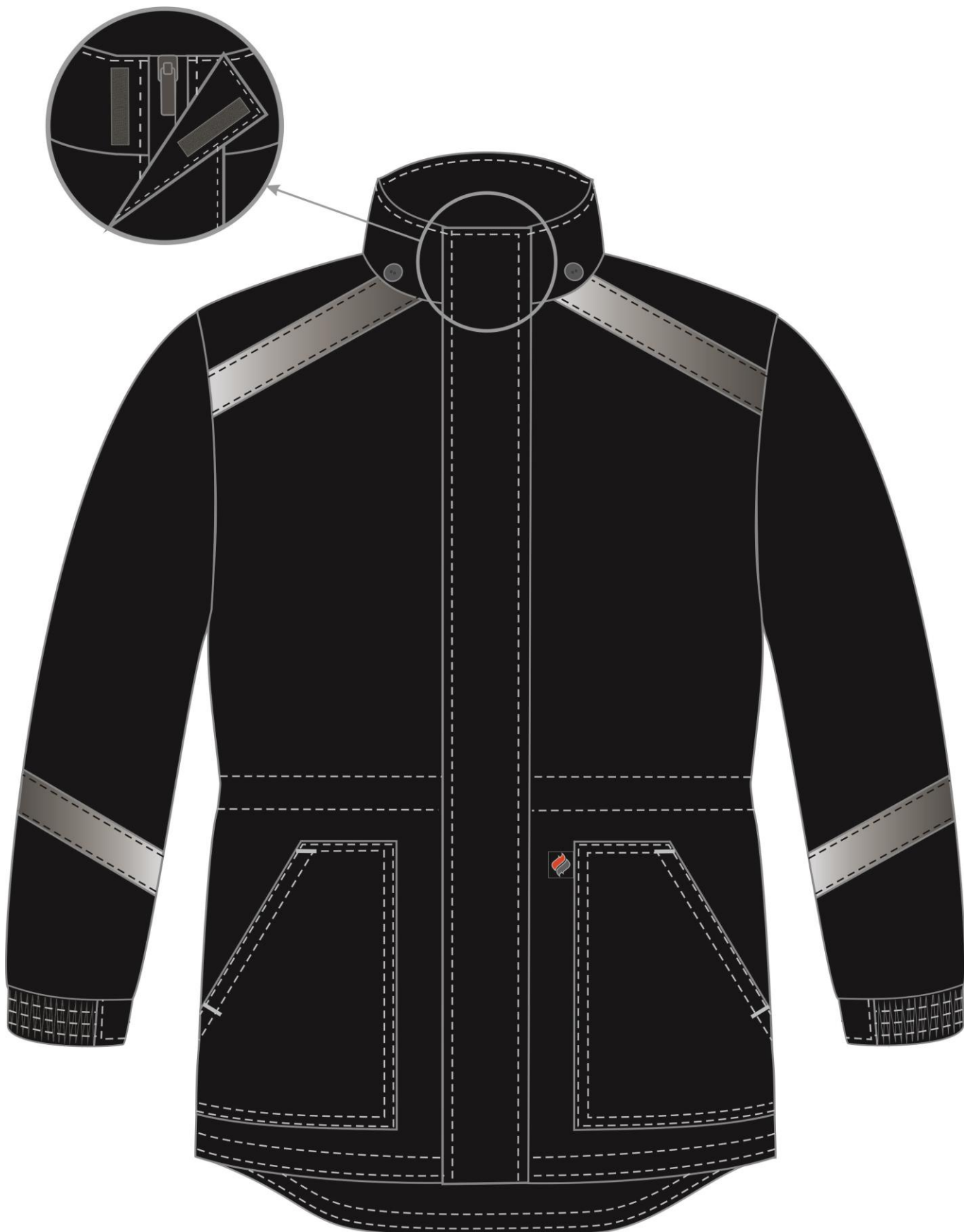
Рис. 5. Эскиз Куртка зимняя Прогресс (тк.Оксфорд), черный Вид спереди.