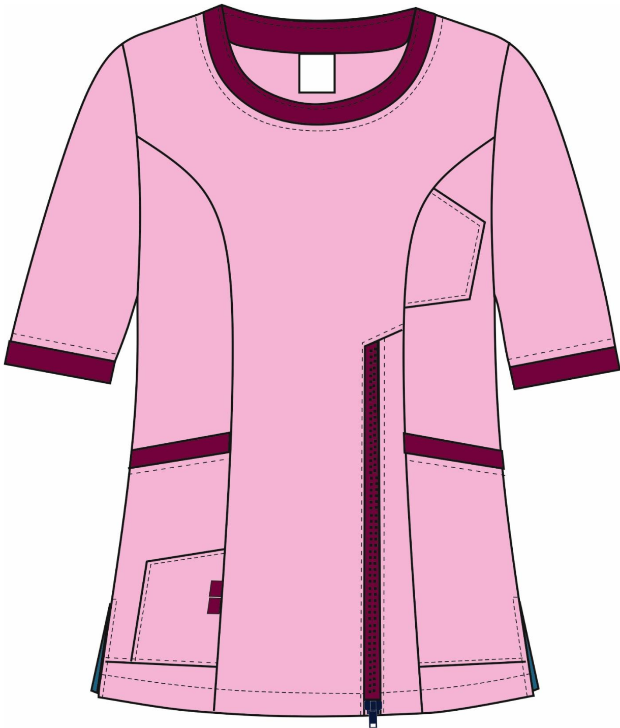
Рис.4. Эскиз Костюм женский Вояж (тк.ТиСи), бордовый/розовый, блуза, вид спереди