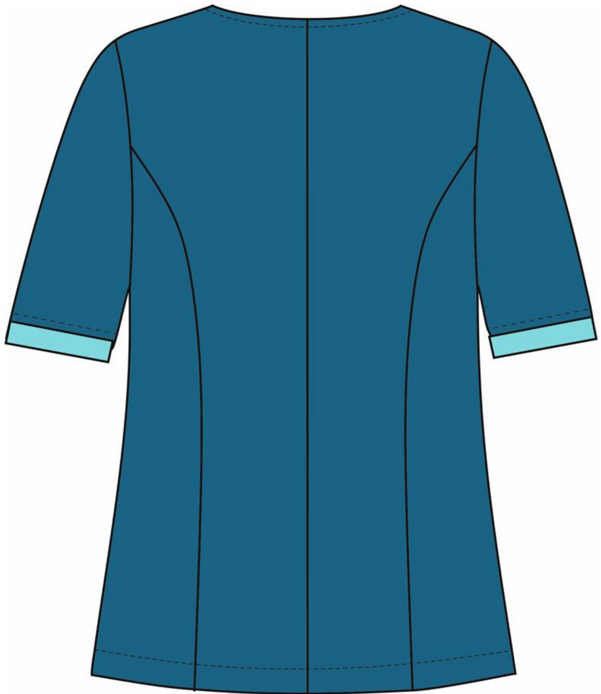
Рис.2. Эскиз Костюм женский Вояж (тк.ТиСи), морская волна, блуза, вид сзади