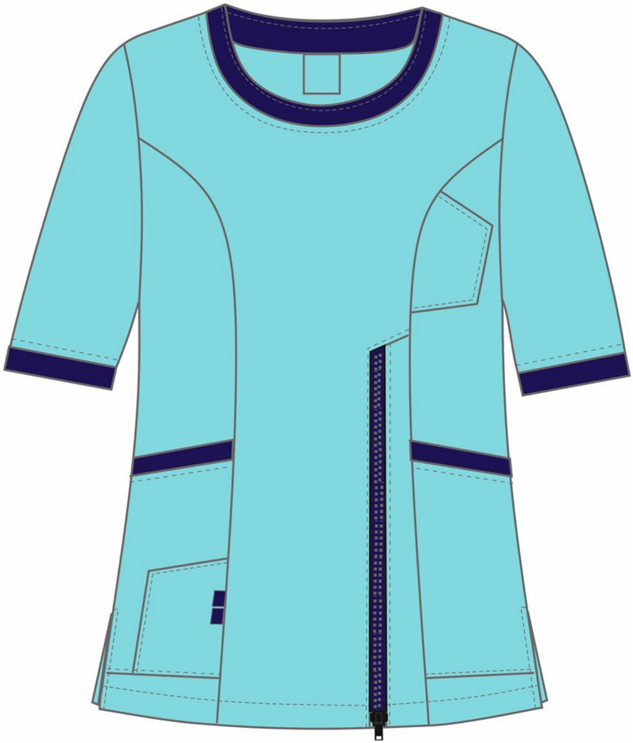
Рис.7. Эскиз Костюм женский Вояж (тк.ТиСи), св.бирюзовый/т.синий, блуза, вид спереди