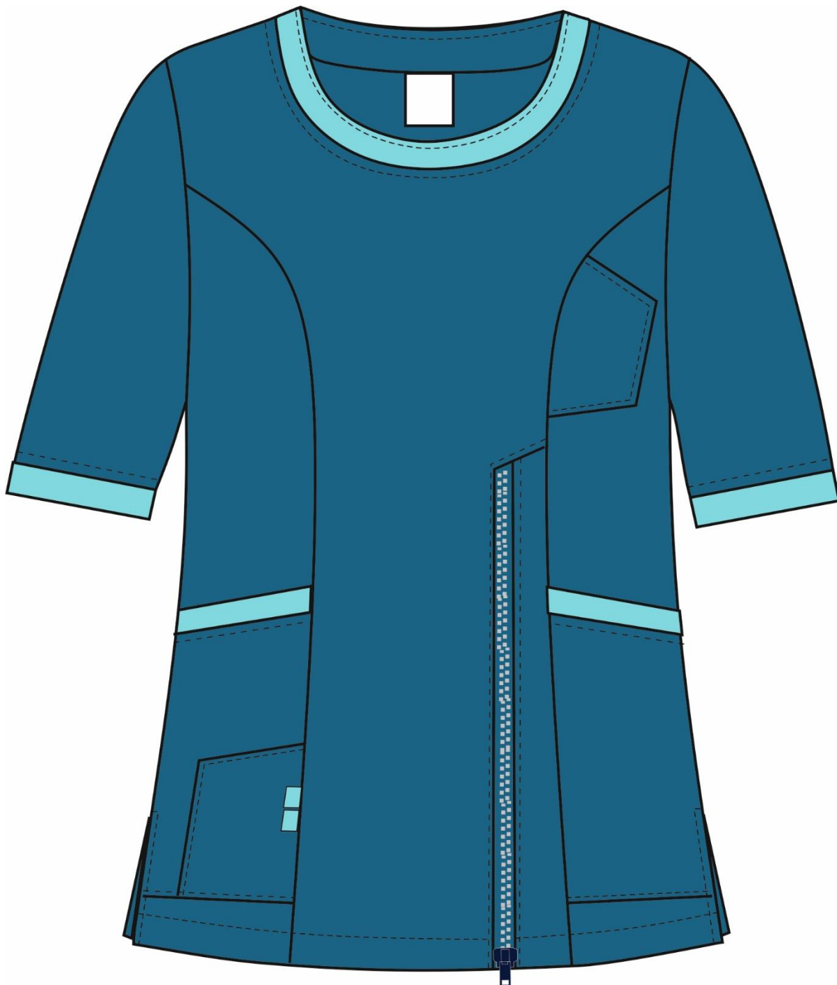
Рис.1. Эскиз Костюм женский Вояж (тк.ТиСи), морская волна, блуза, вид спереди