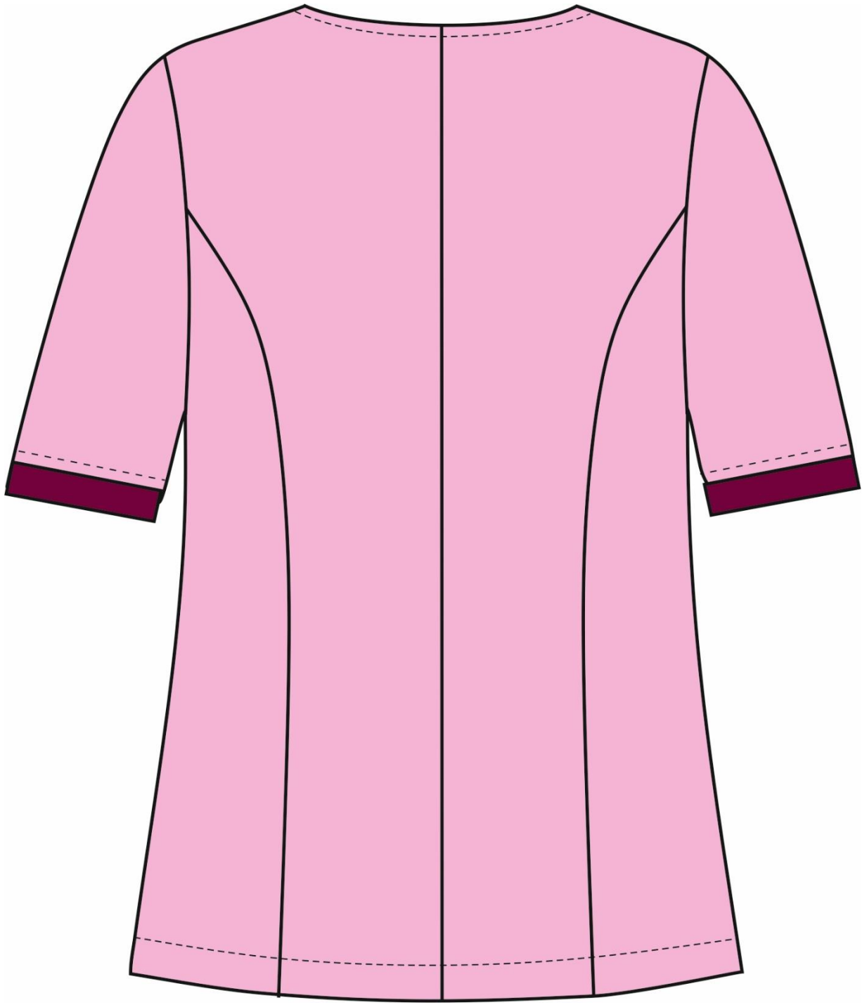
Рис.5. Эскиз Костюм женский Вояж (тк.ТиСи), бордовый/розовый, блуза, вид сзади