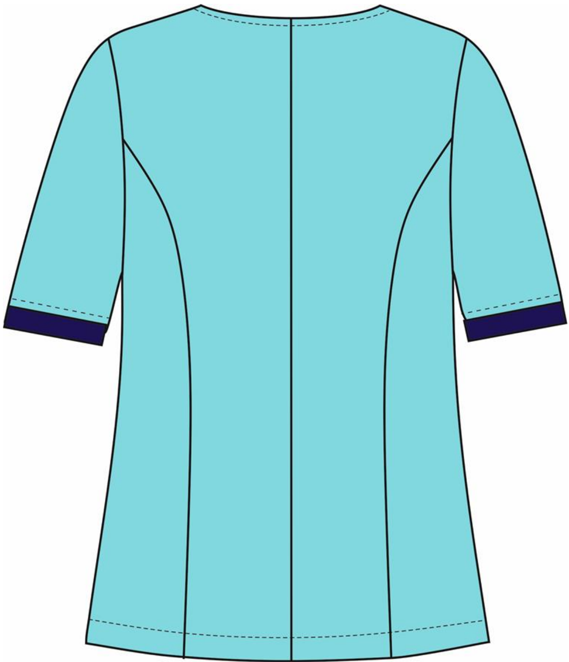
Рис.8. Эскиз Костюм женский Вояж (тк.ТиСи), св.бирюзовый/т.синий, блуза, вид сзади