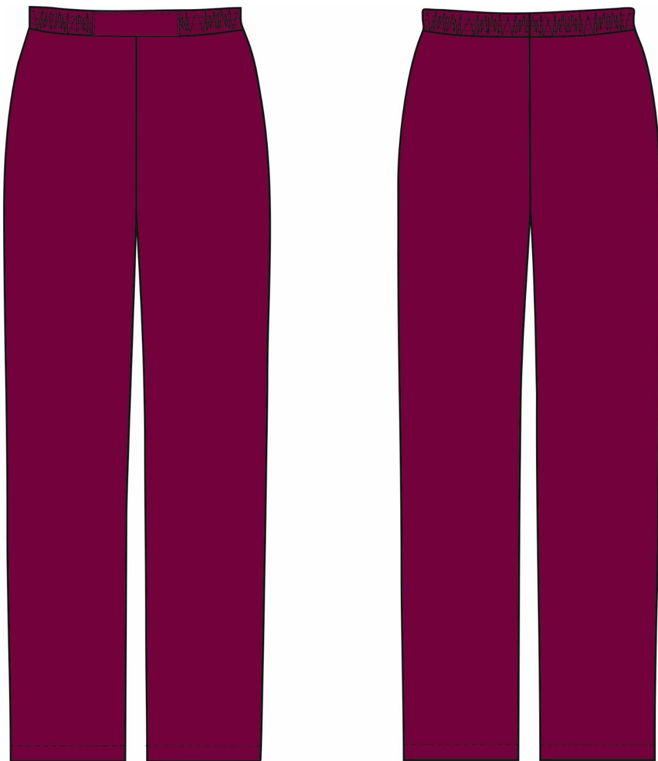
Рис.6. Эскиз Костюм женский Вояж (тк.ТиСи), бордовый/розовый, брюки, вид спереди и сзади