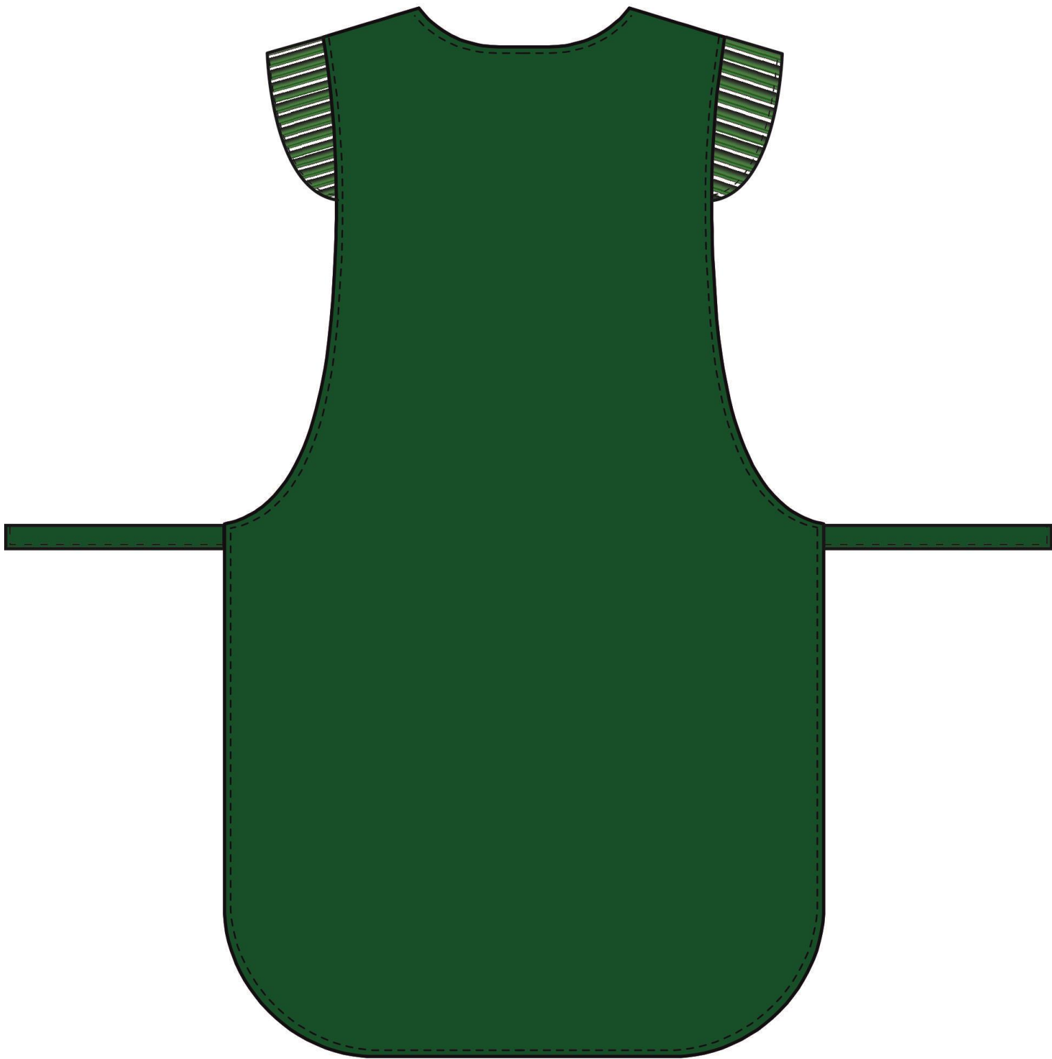
Рис.2. Эскиз. Фартук-сарафан Надежда (тк.ТиСи), зеленый Фартук, вид сзади.