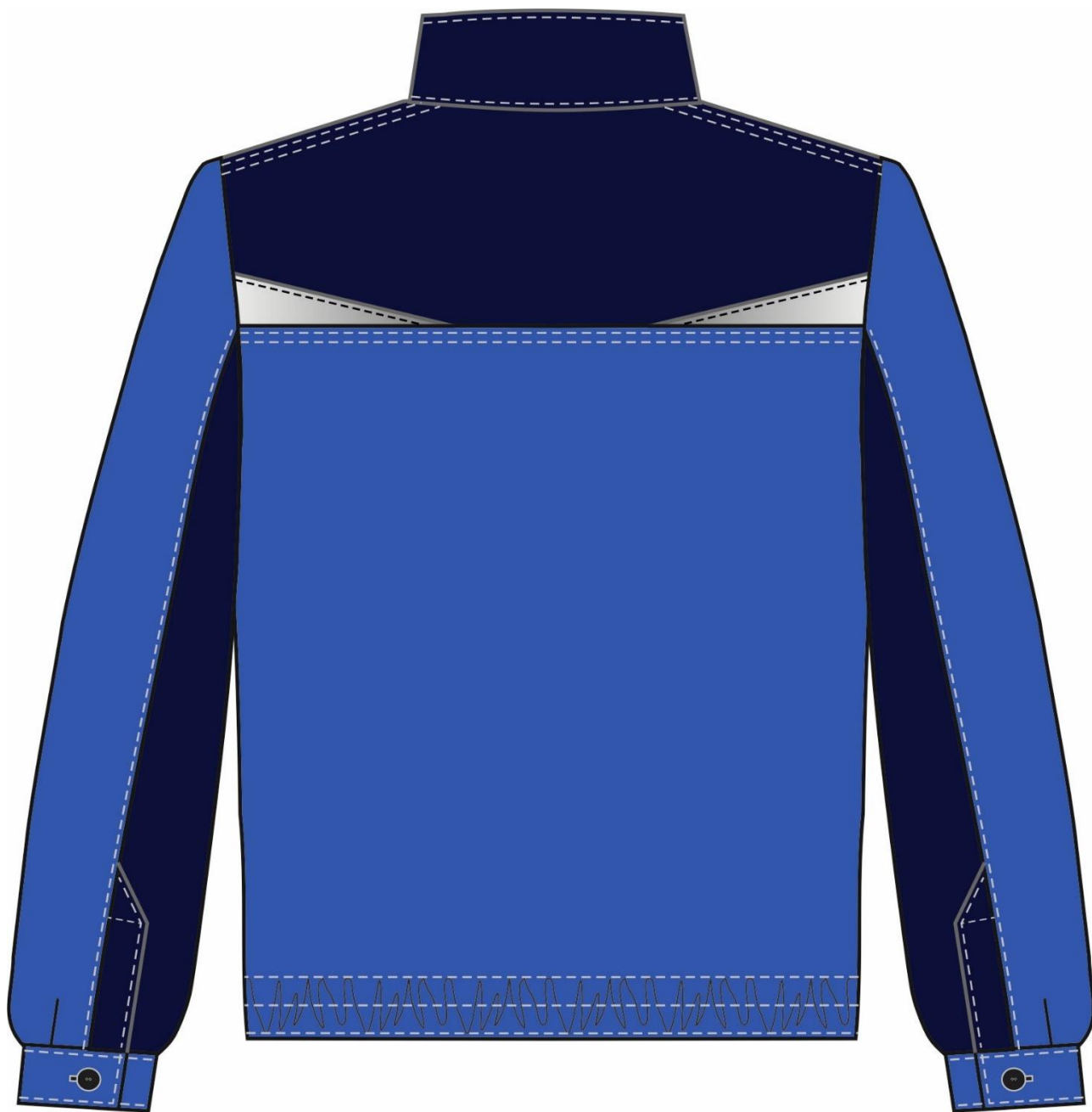
Рис. 2. Эскиз Костюм Строй-2 (тк.Смесовая,240) п/к, васильковый/т.синий.. Куртка, вид сзади.