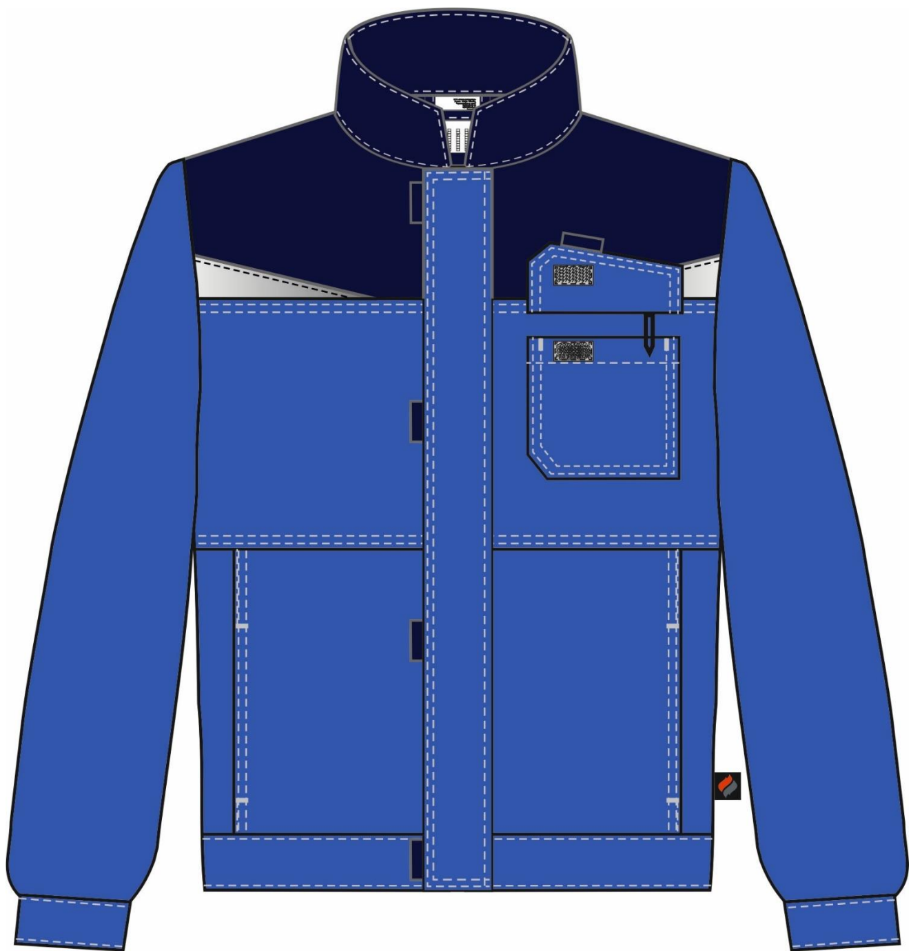
Рис. 1. Эскиз Костюм Строй-2 (тк.Смесовая,240) п/к, васильковый/т.синий. Куртка, вид спереди.