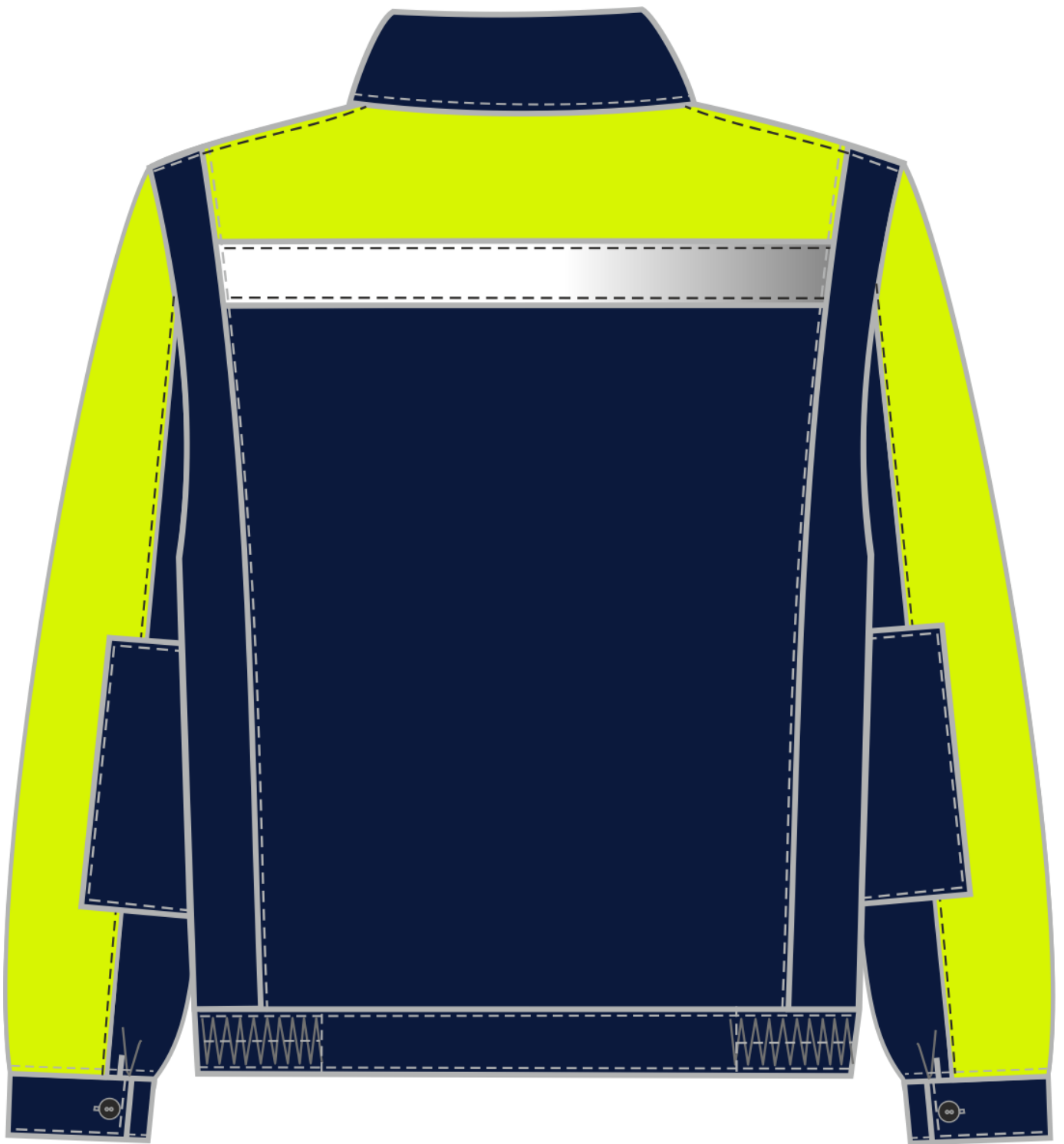
Рис. 2. Эскиз костюм Сфера NEW т.синий/лимонный. Куртка, вид сзади.