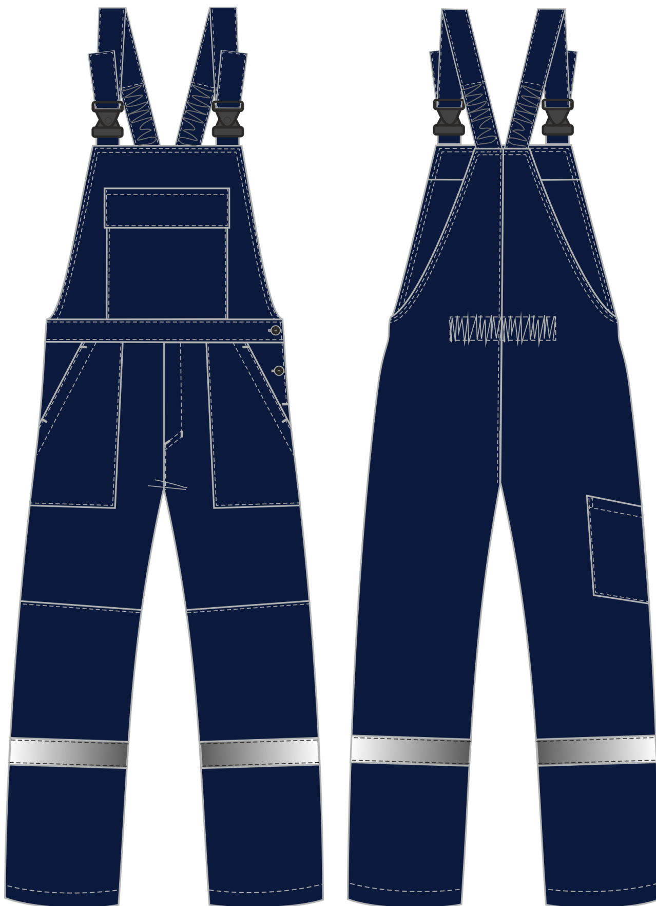
Рис. 3. Эскиз костюм Сфера NEW, т.синий/лимонный. Полукомбинезон, вид спереди и сзади.