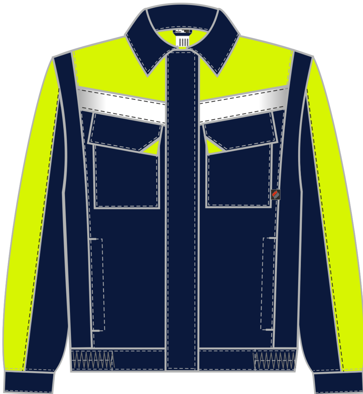
Рис. 1. Эскиз костюм Сфера NEW т.синий/лимонный. Куртка, вид спереди.