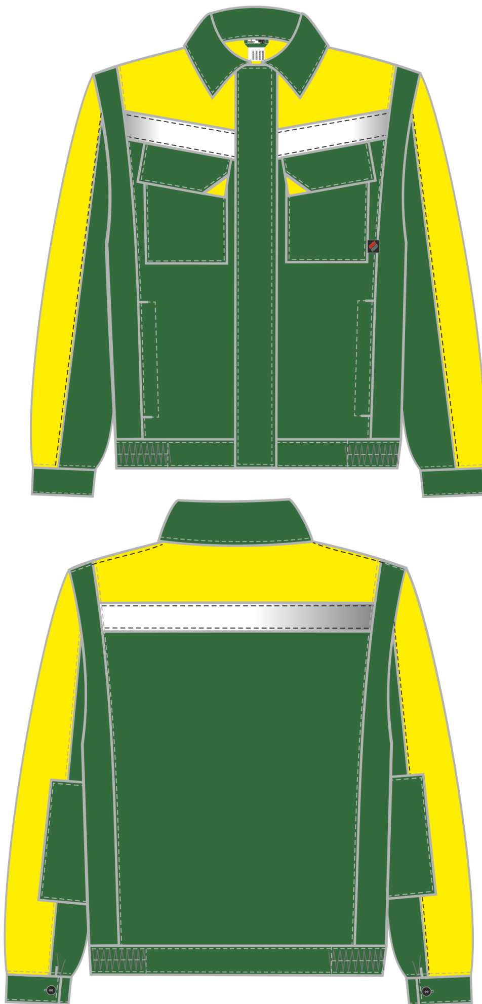
Рис. 6. Эскиз костюм Сфера NEW, зеленый/желтый. Куртка, вид спереди и сзади.