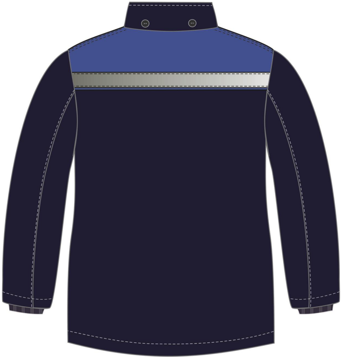
Рис. 8. Эскиз Костюм зимний Партнер NEW (тк.Смесовая, 210) п/к, т.синий/васильковый. Куртка, вид сзади