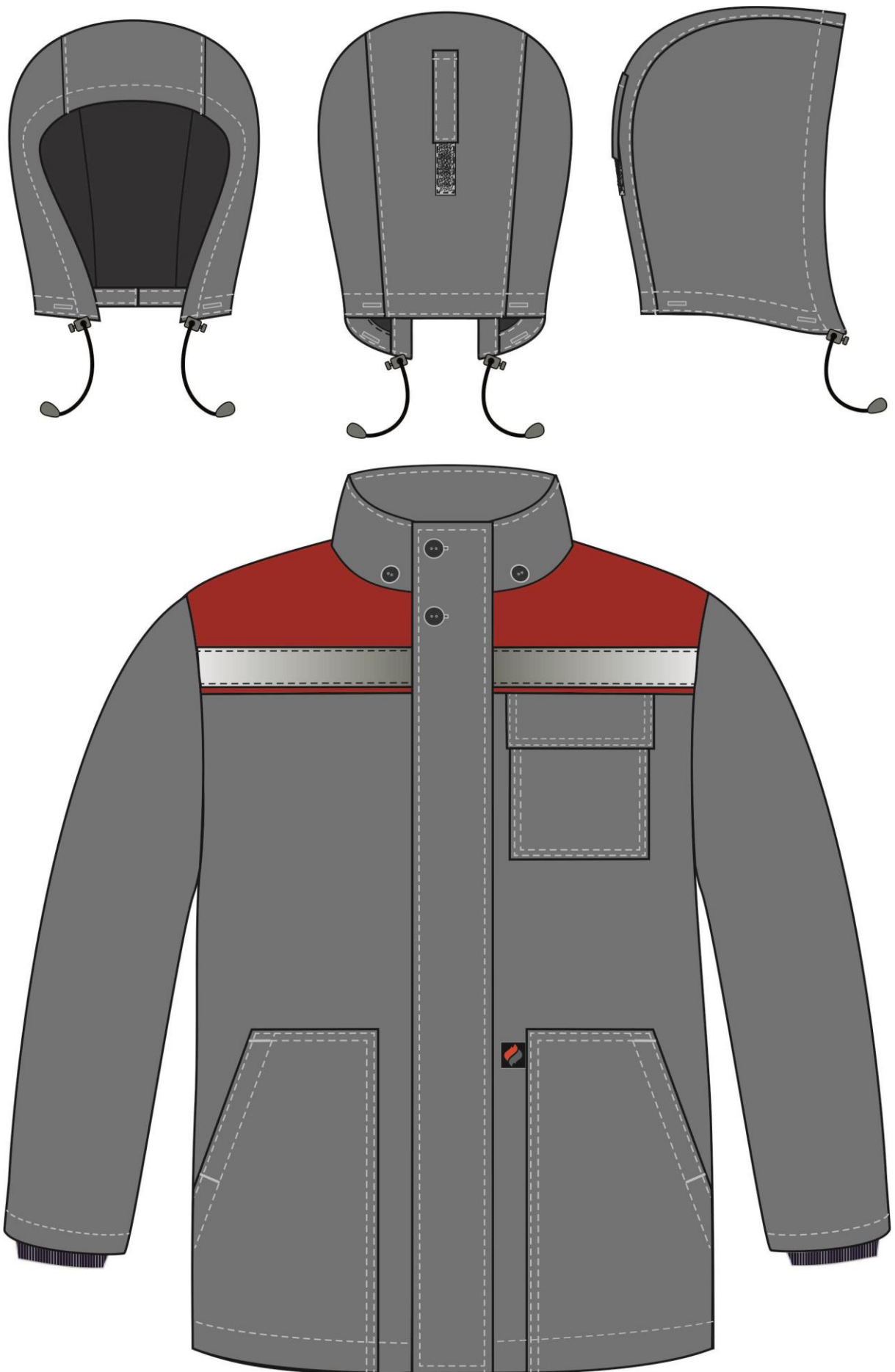
Рис. 9. Эскиз Костюм зимний Партнер (тк.Смесовая, 210) п/к, т.серый/красный. Куртка, вид спереди