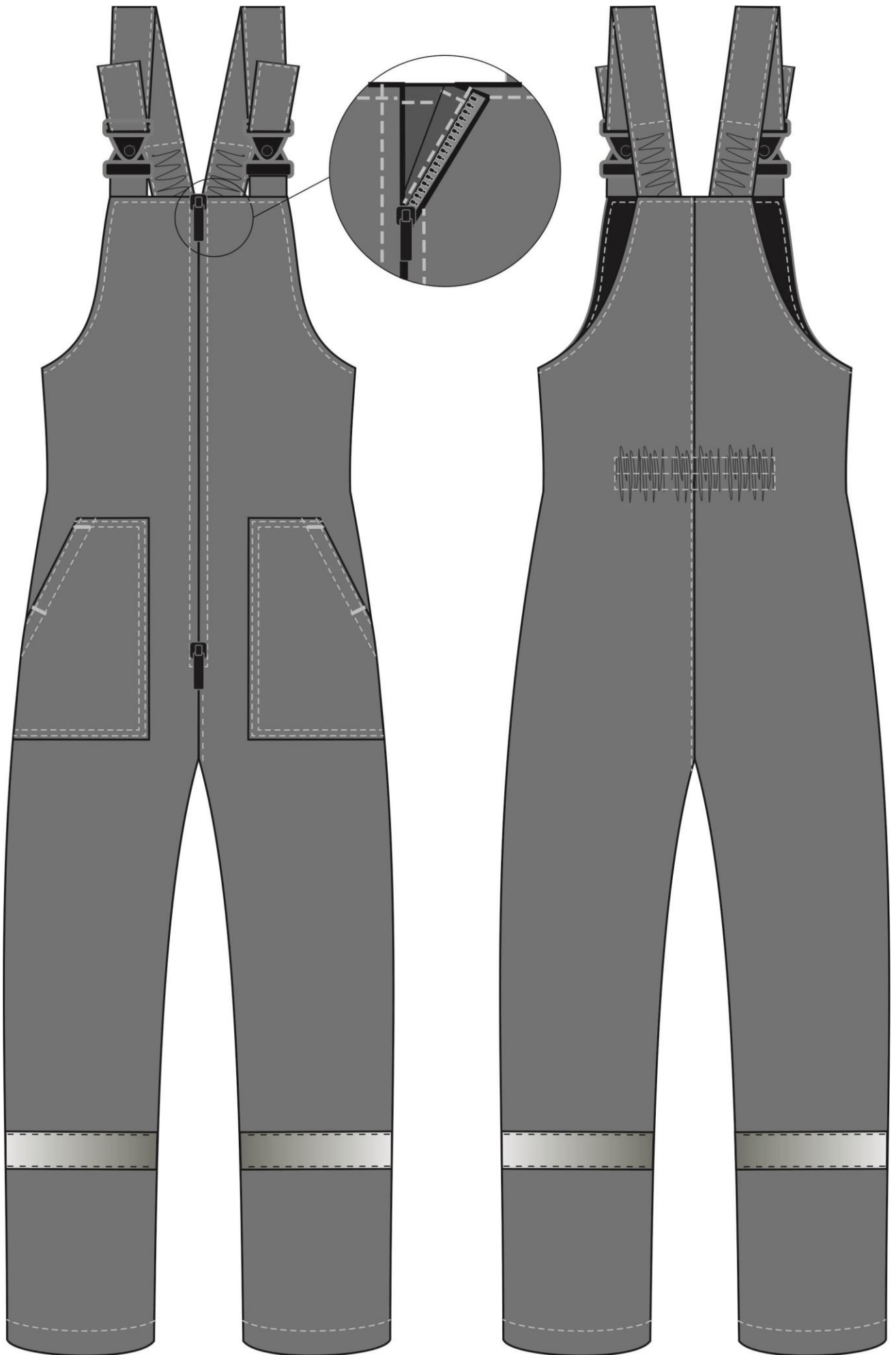
Рис. 12. Костюм зимний Партнер NEW (тк.Смесовая,210) п/к, т.серый/оранжевый. Полукомбинезон, вид спереди и сзади