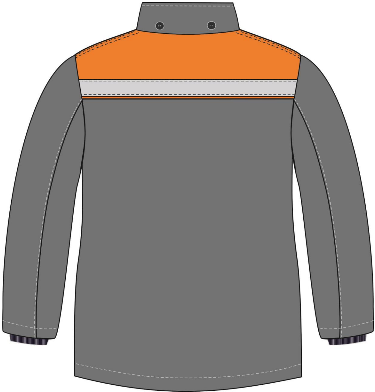
Рис. 4. Эскиз Костюм зимний Партнер NEW (тк.Смесовая,210) п/к, т.серый/оранжевый. Куртка, вид сзади