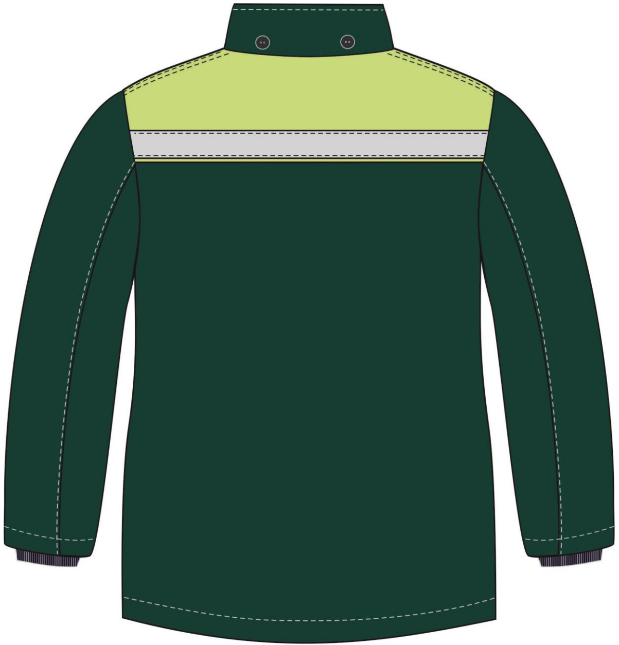
Рис. 6. Эскиз Костюм зимний Партнер NEW (тк.Смесовая,210) п/к, зеленый/лимон. Куртка, вид сзади