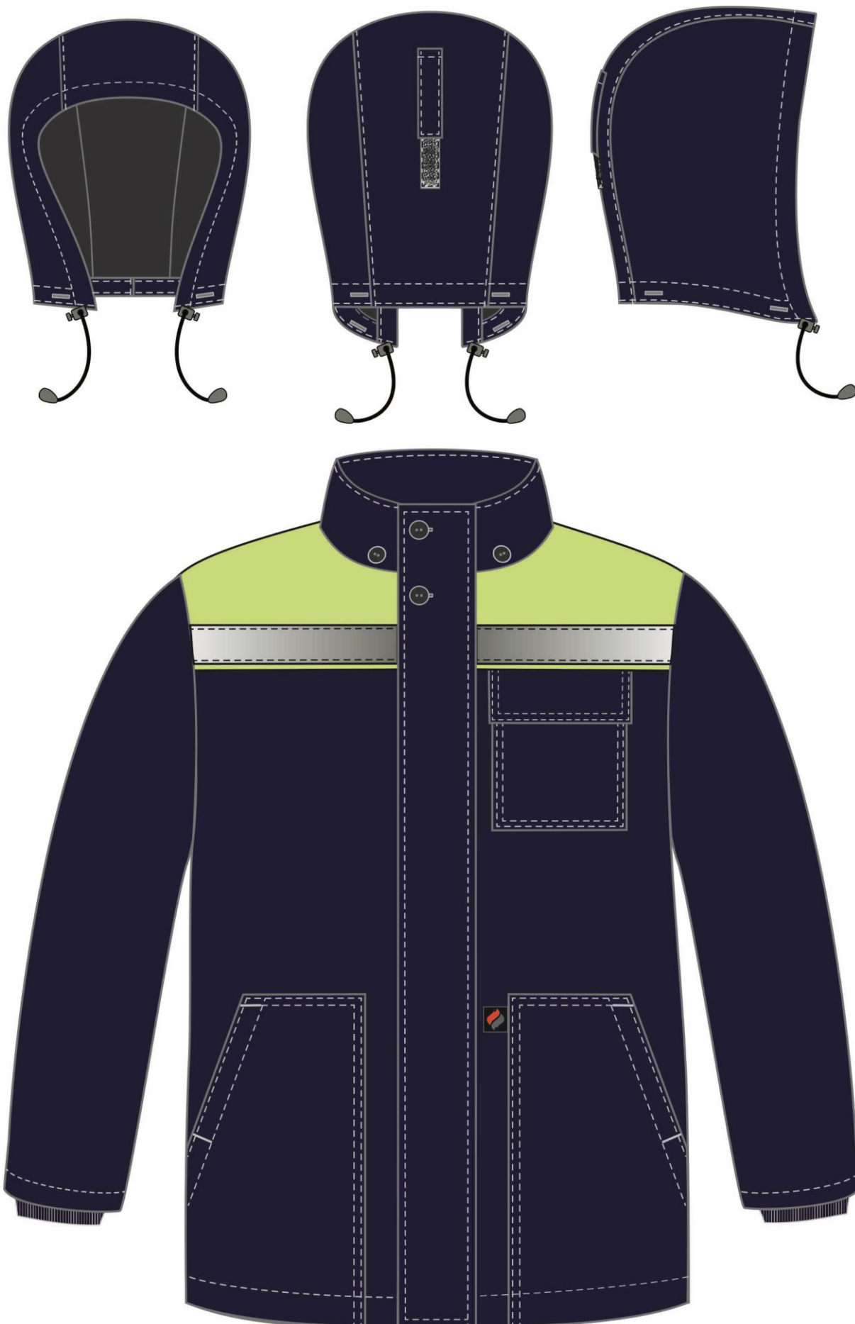
Рис. 1. Эскиз Костюм зимний Партнер NEW (тк.Смесовая,210) п/к, т.синий/лимонный. Куртка, вид спереди