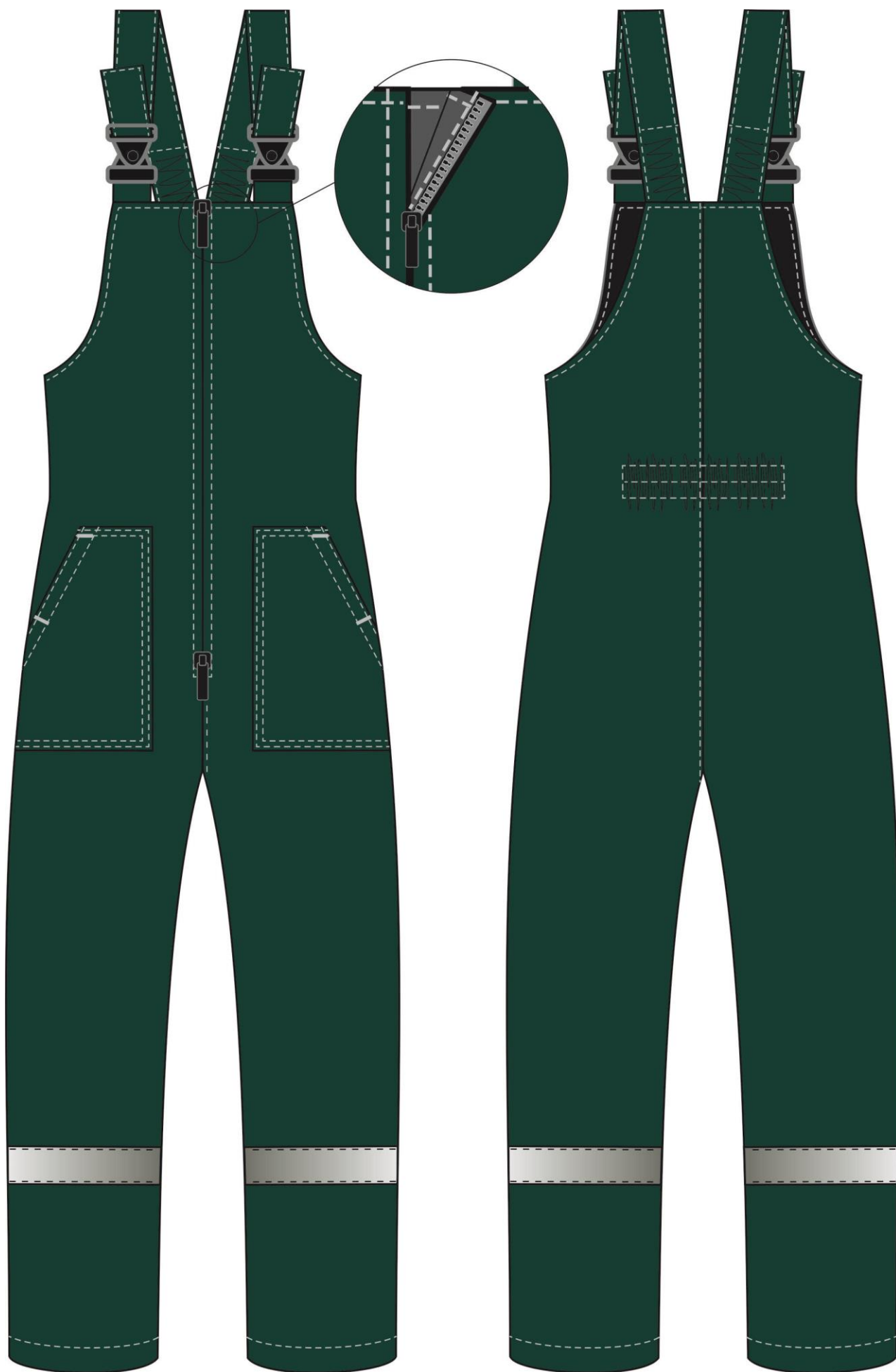
Рис. 13. Эскиз Костюм зимний Партнер NEW (тк.Смесовая,210) п/к, зеленый/лимон Полукомбинезон, вид спереди и сзади