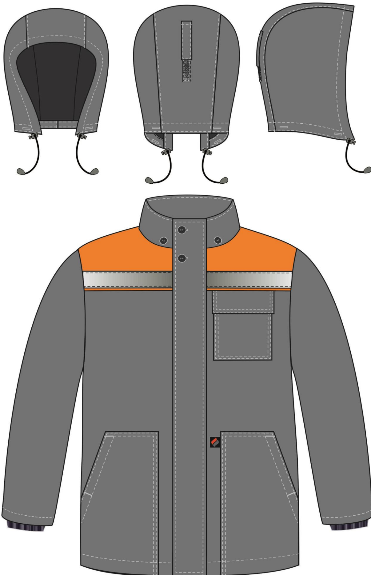
Рис. 3. Эскиз Костюм зимний Партнер NEW (тк.Смесовая,210) п/к, т.серый/оранжевый. Куртка, вид спереди