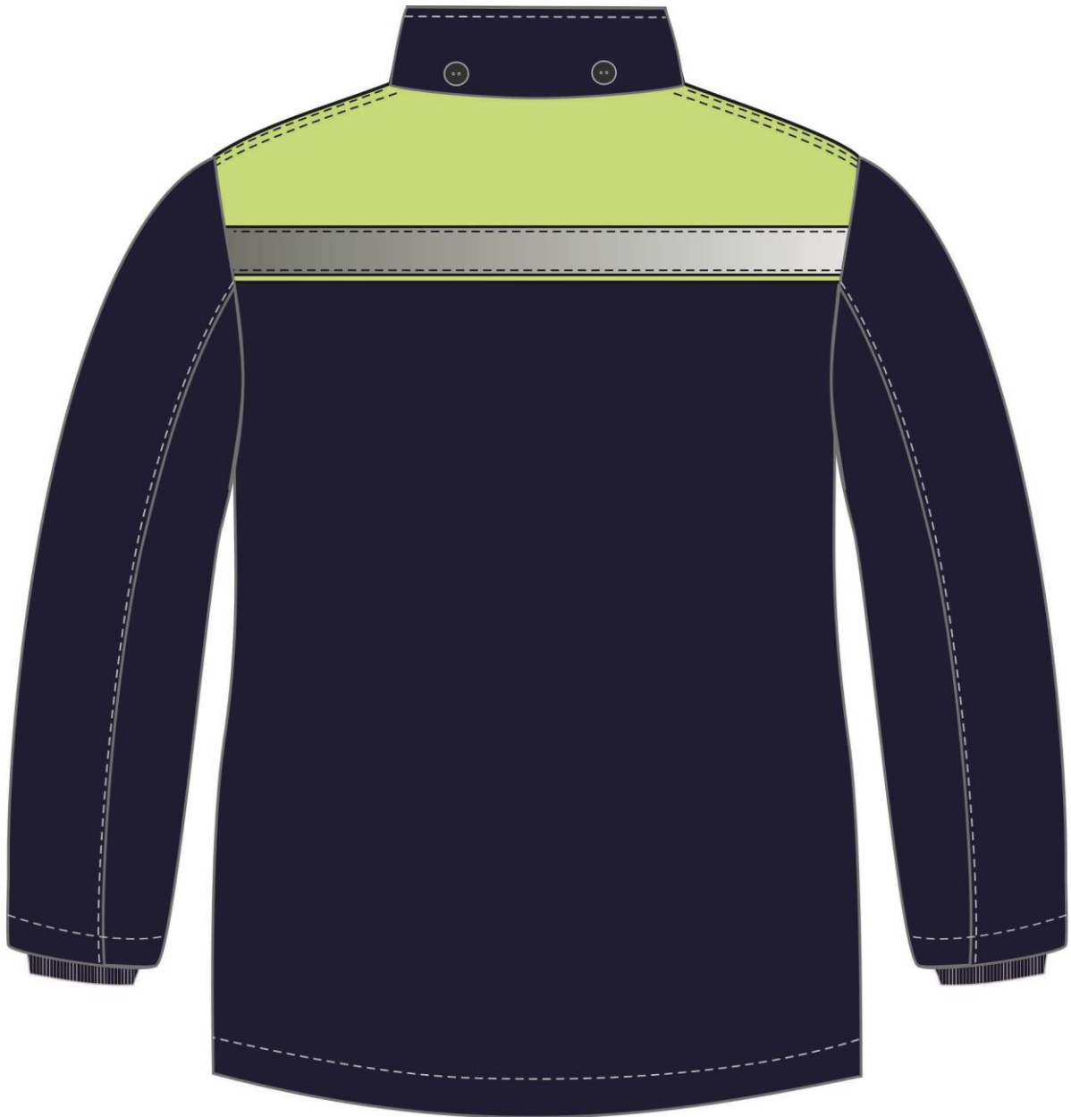
Рис. 2. Эскиз Костюм зимний Партнер NEW (тк.Смесовая,210) п/к, т.синий/лимонный. Куртка, вид сзади