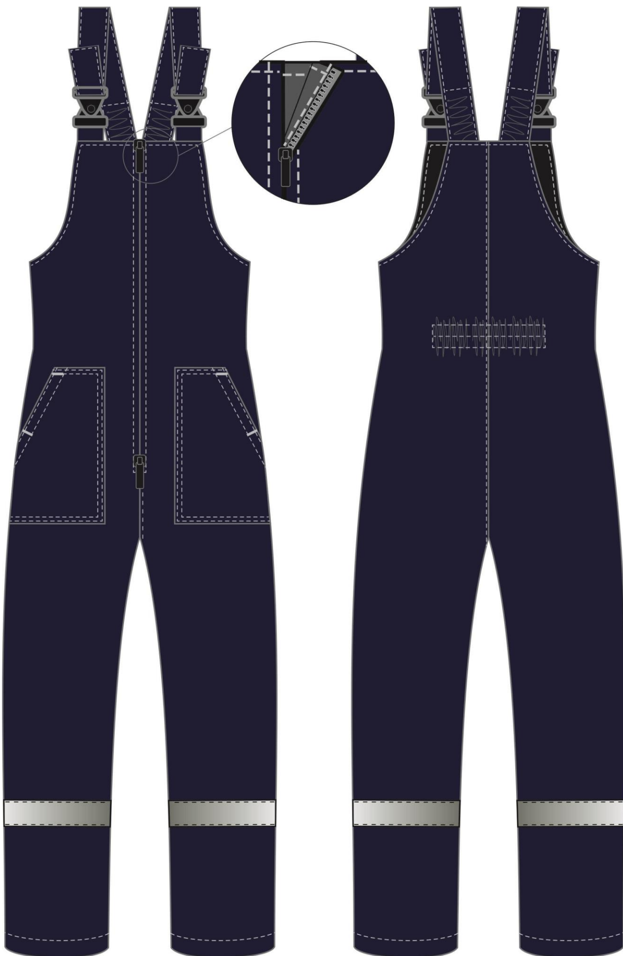
Рис. 14. Эскиз Костюм зимний Партнер NEW (тк.Смесовая, 210) п/к, т.синий/васильковый. Полукомбинезон, вид спереди и сзади