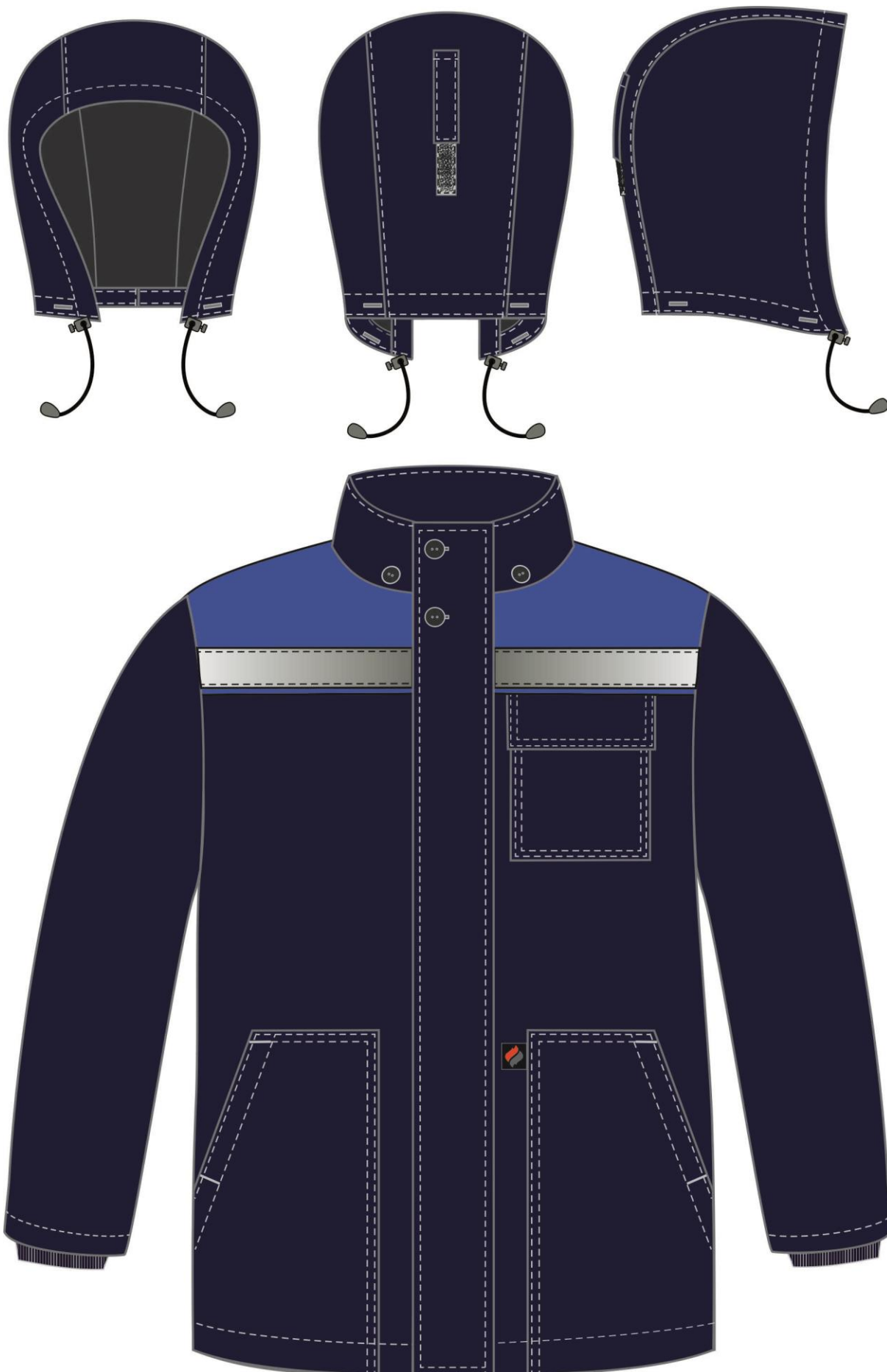
Рис. 7. Эскиз Костюм зимний Партнер NEW (тк.Смесовая, 210) п/к, т.синий/васильковый. Куртка, вид спереди