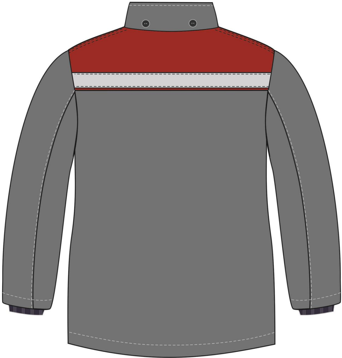
Рис. 10. Эскиз Костюм зимний Партнер (тк.Смесовая, 210) п/к, т.серый/красный. Куртка, вид сзади