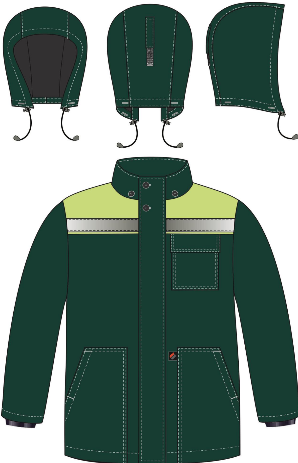
Рис. 5. Эскиз Костюм зимний Партнер NEW (тк.Смесовая,210) п/к, зеленый/лимон. Куртка, вид спереди