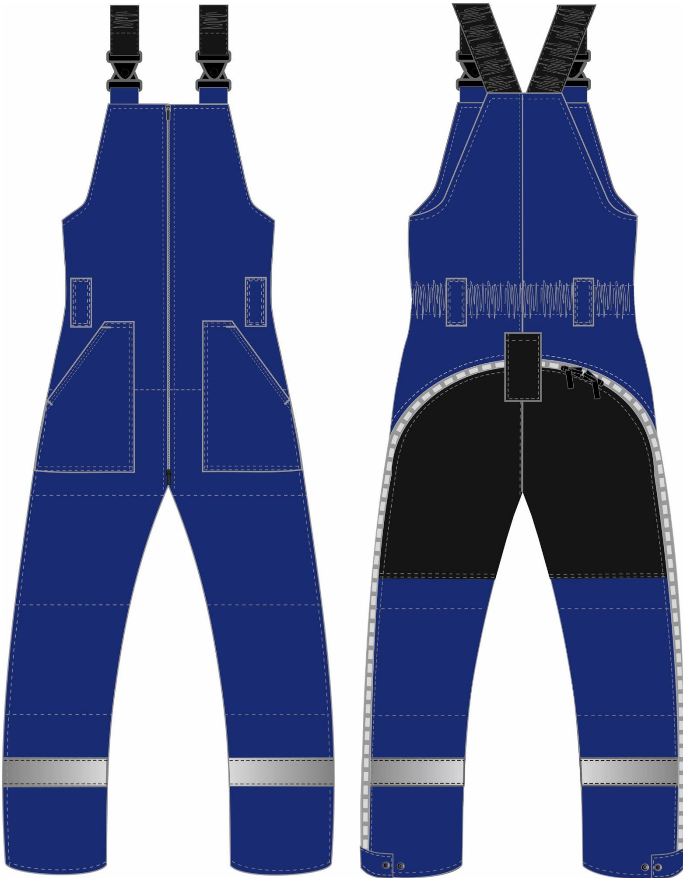
Рис. 3. Эскиз Костюм зимний Беркут (тк.Таслан) п/к, т.синий/черный, полукombineзон, вид спереди и сзади.