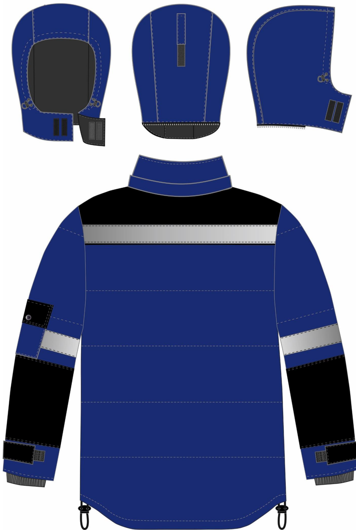
Рис. 2. Эскиз Костюм зимний Беркут (тк.Таслан) п/к, т.синий/черный, куртка, вид сзади.