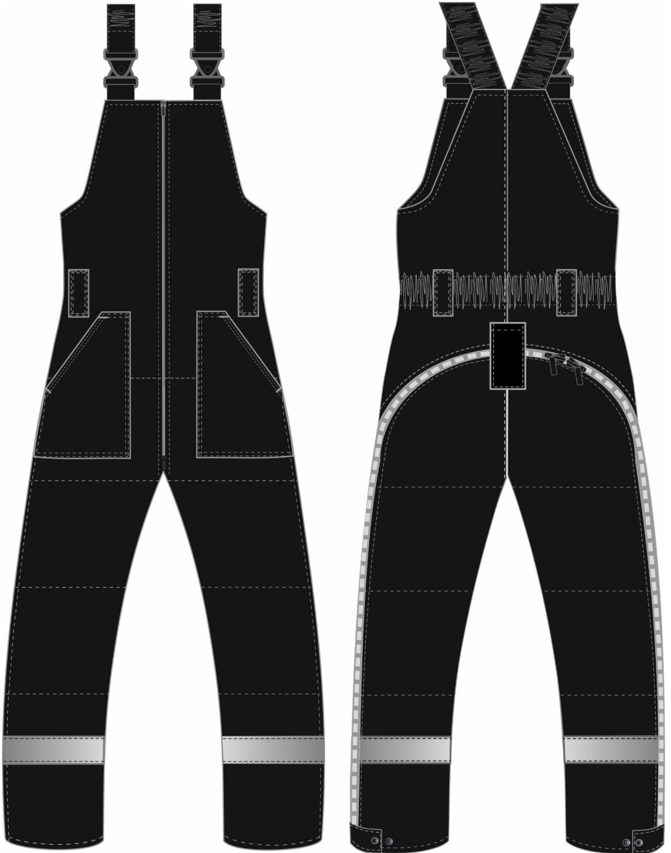
Рис. 8. Эскиз Костюм зимний Беркут (тк.Таслан) п/к, черный/т.серый и черный/красный, полукомбинезон, вид спереди и сзади.