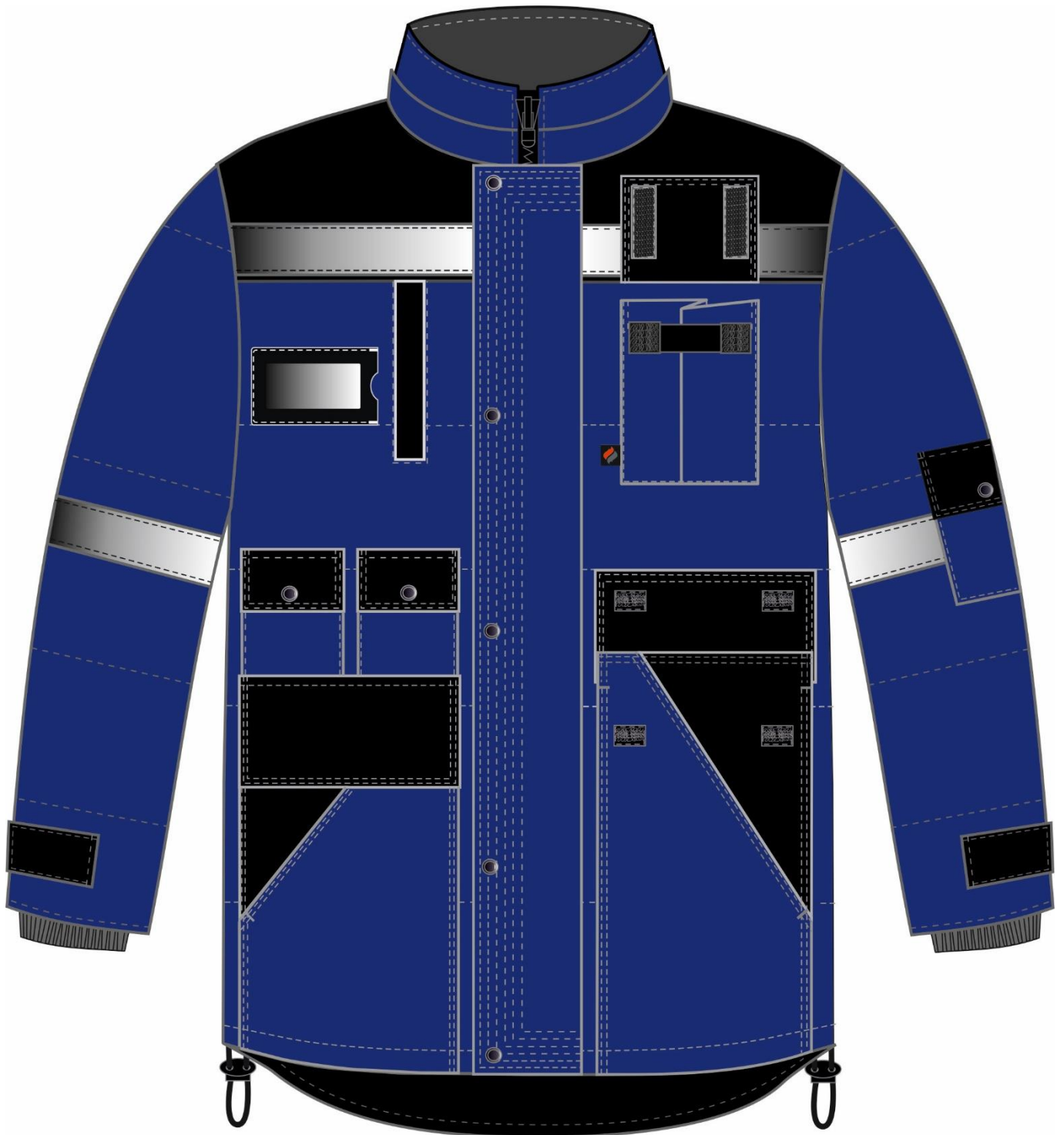
Рис. 1. Эскиз Костюм зимний Беркут (тк.Таслан) п/к, т.синий/черный, куртка, вид спереди.