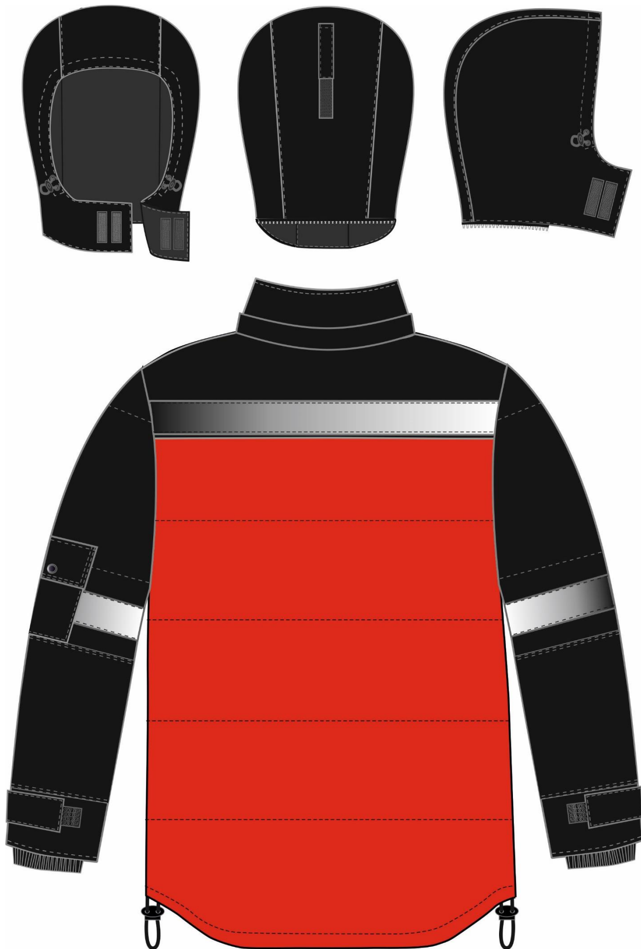
Рис. 7. Эскиз Костюм зимний Беркут (тк.Таслан) п/к, черный/красный, куртка, вид сзади.