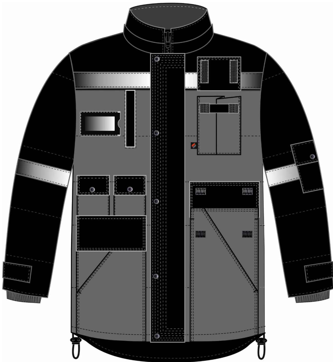
Рис. 4. Эскиз Костюм зимний Беркут (тк.Таслан) п/к, черный/т.серый, куртка, вид спереди.