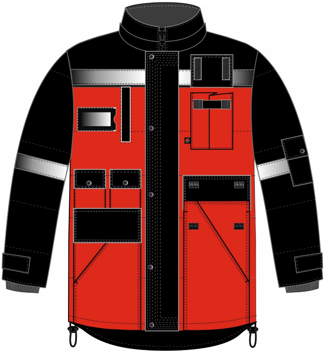
Рис. 6. Эскиз Костюм зимний Беркут (тк.Таслан) п/к, черный/красный, куртка, вид спереди.