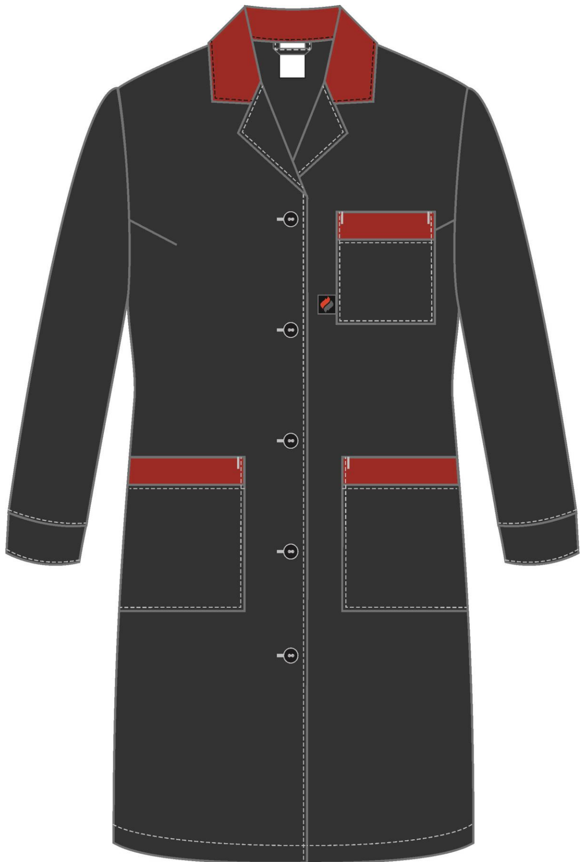
Рис. 1. Эскиз Халат женский Технолог (тк.Смесовая,210), т.серый/красный, вид спереди.