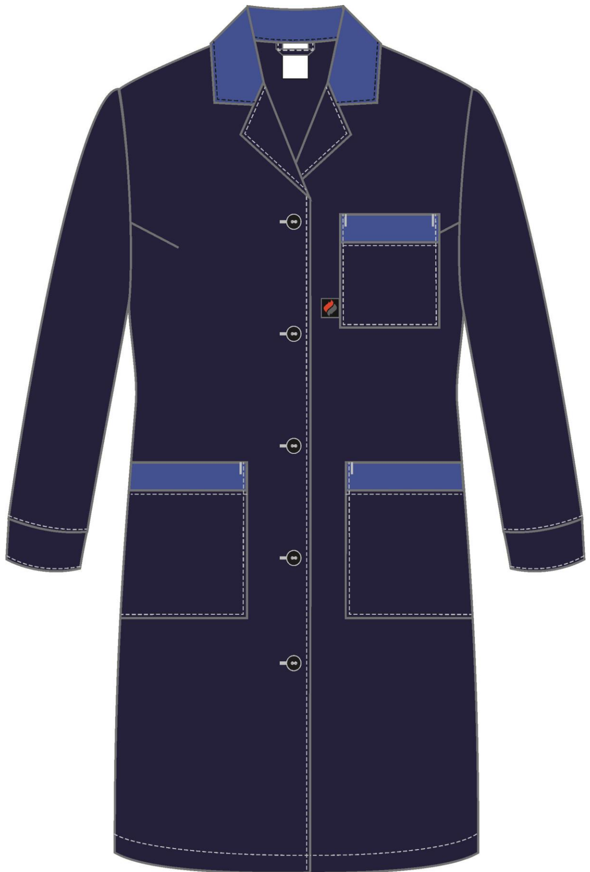
Рис. 3. Эскиз Халат женский Технолог (тк.Смесовая,210), т.синий/васильковый, вид сзади.