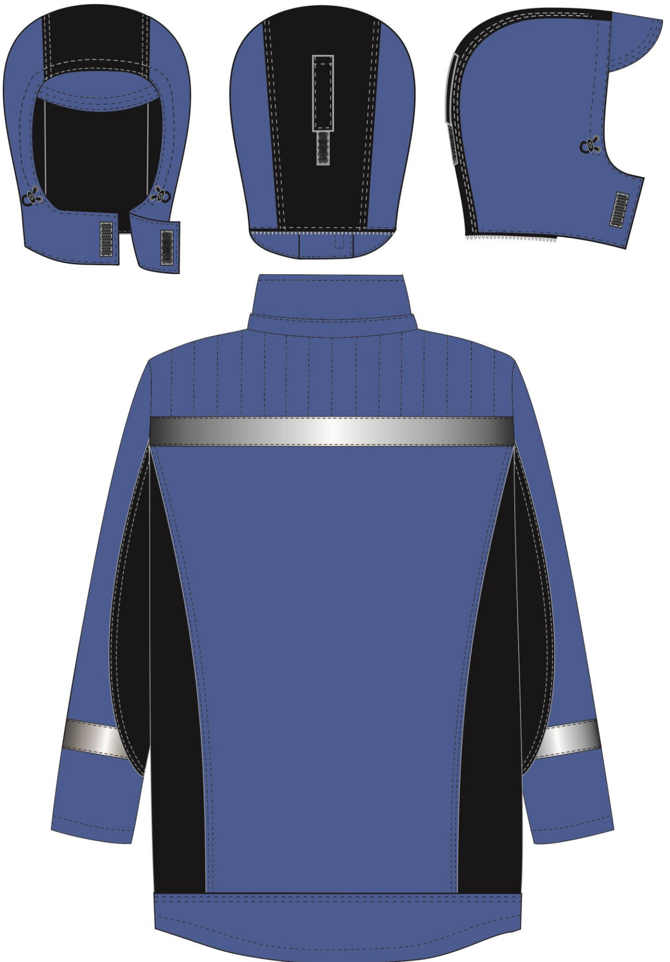
Рис. 1. Эскиз Костюм зимний Фаворит-Мега (тк.Таслан) п/к, т.синий/черный. Куртка, вид сзади