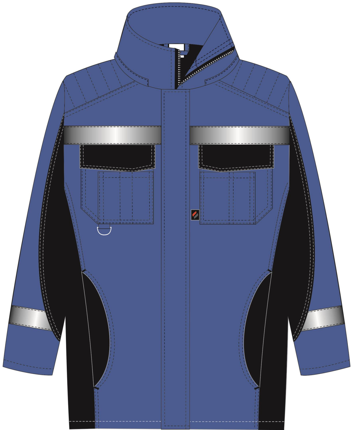
Рис. 1. Эскиз Костюм зимний Фаворит-Мега (тк.Таслан) п/к, т.синий/черный. Куртка, вид спереди