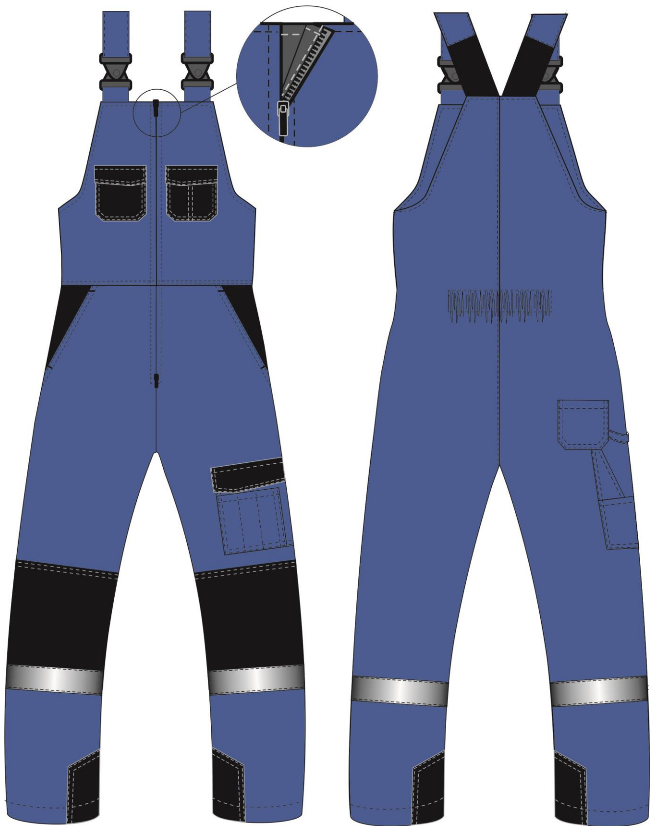
Рис. 3. Эскиз Костюм зимний Фаворит-Мега (тк.Таслан) п/к, т.синий/черный. Полукомбинезон, вид спереди и сзади.