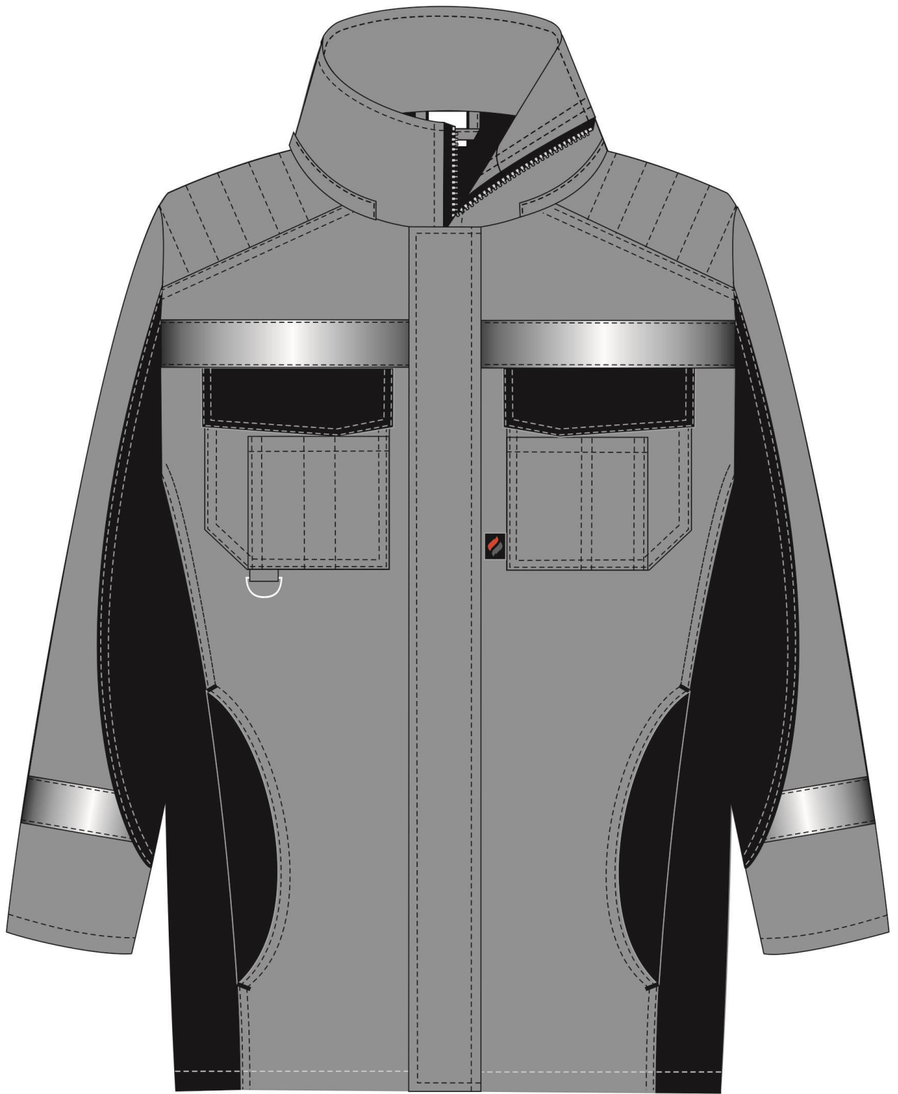
Рис. 1. Эскиз Костюм зимний Фаворит-Мега (тк.Таслан) п/к, т.серый/черный. Куртка, вид спереди