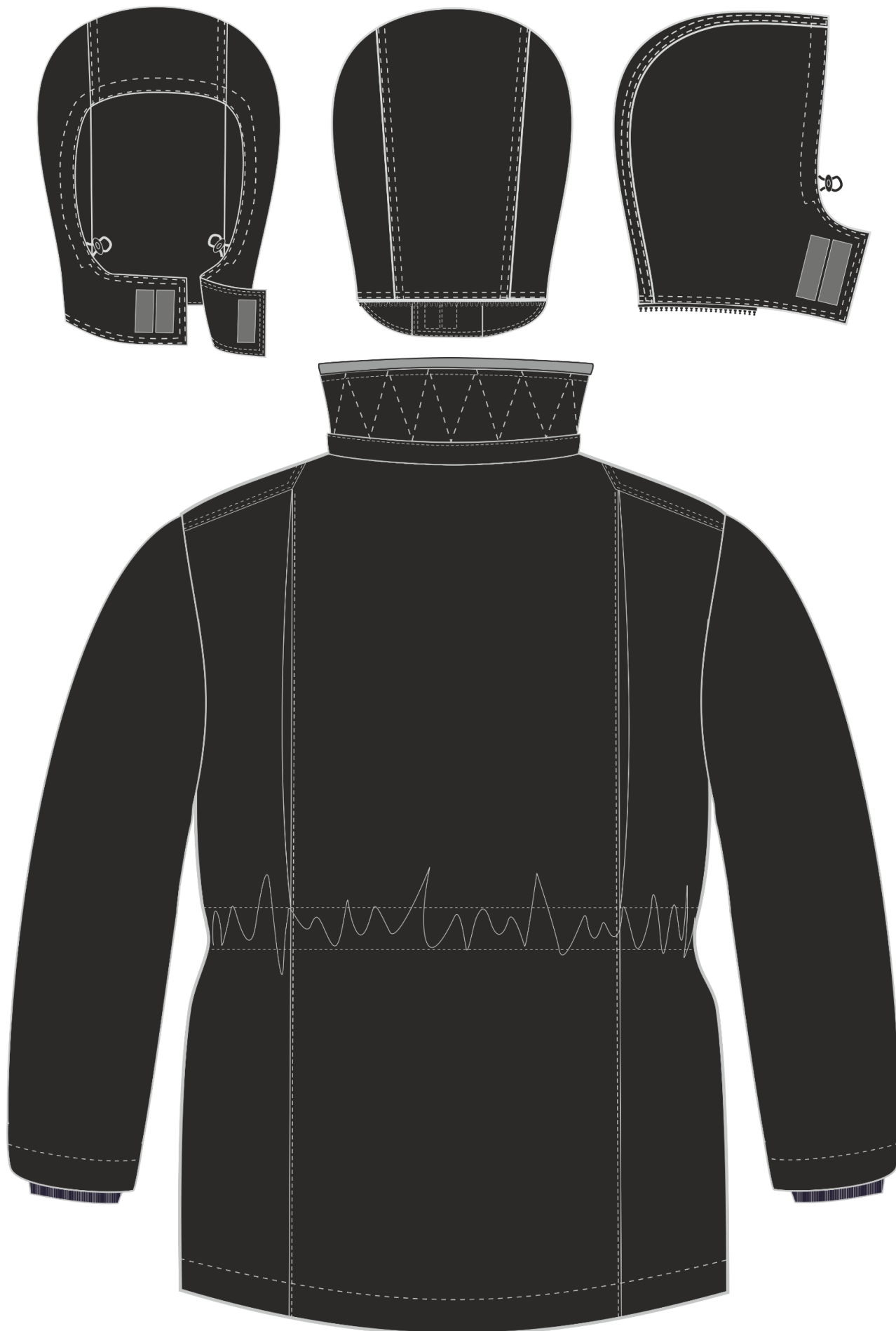
Рис. 2. Эскиз Костюм зимний для Охранника (полукомбинезон), черный. Куртка, вид сзади. Капюшон, вид спереди, сзади и сбоку.