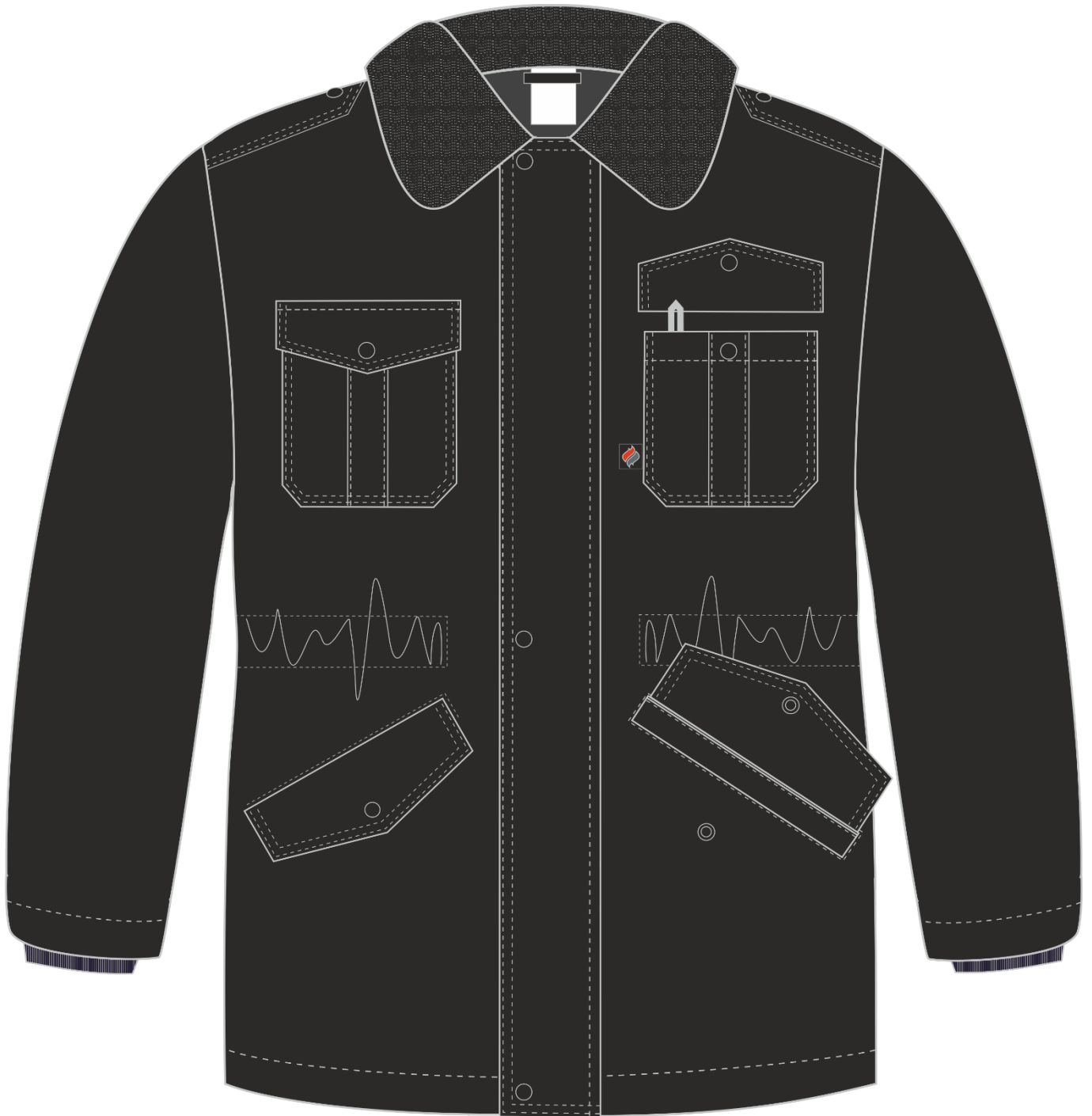
Рис.1.Эскиз Костюм зимний для Охранника (полукомбинезон), черный. Куртка, вид спереди.