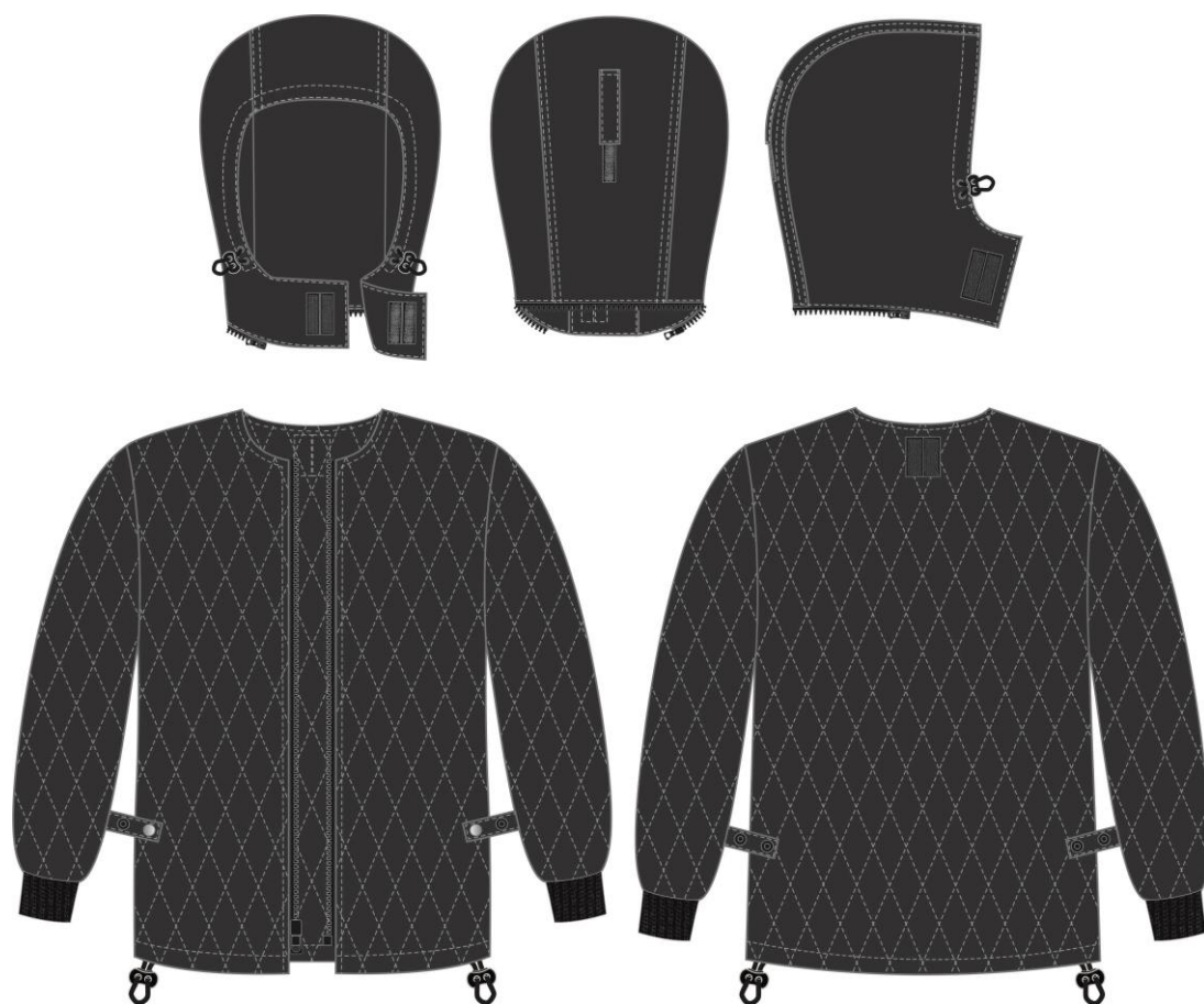
Рис. 4. Эскиз Костюм зимний Сибир СОП (тк.Балтекс,210) п/к, т.серый/красный. Куртка, вид спереди. Подстежка и капюшон, вид спереди и сзади.