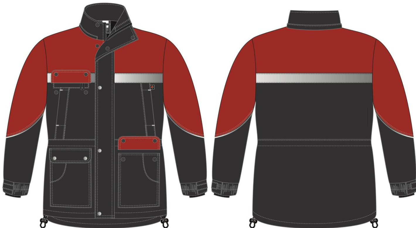
Рис. 2. Эскиз Костюм зимний Сибир СОП (тк.Балтекс,210) п/к, т.серый/красный. Куртка, вид спереди.