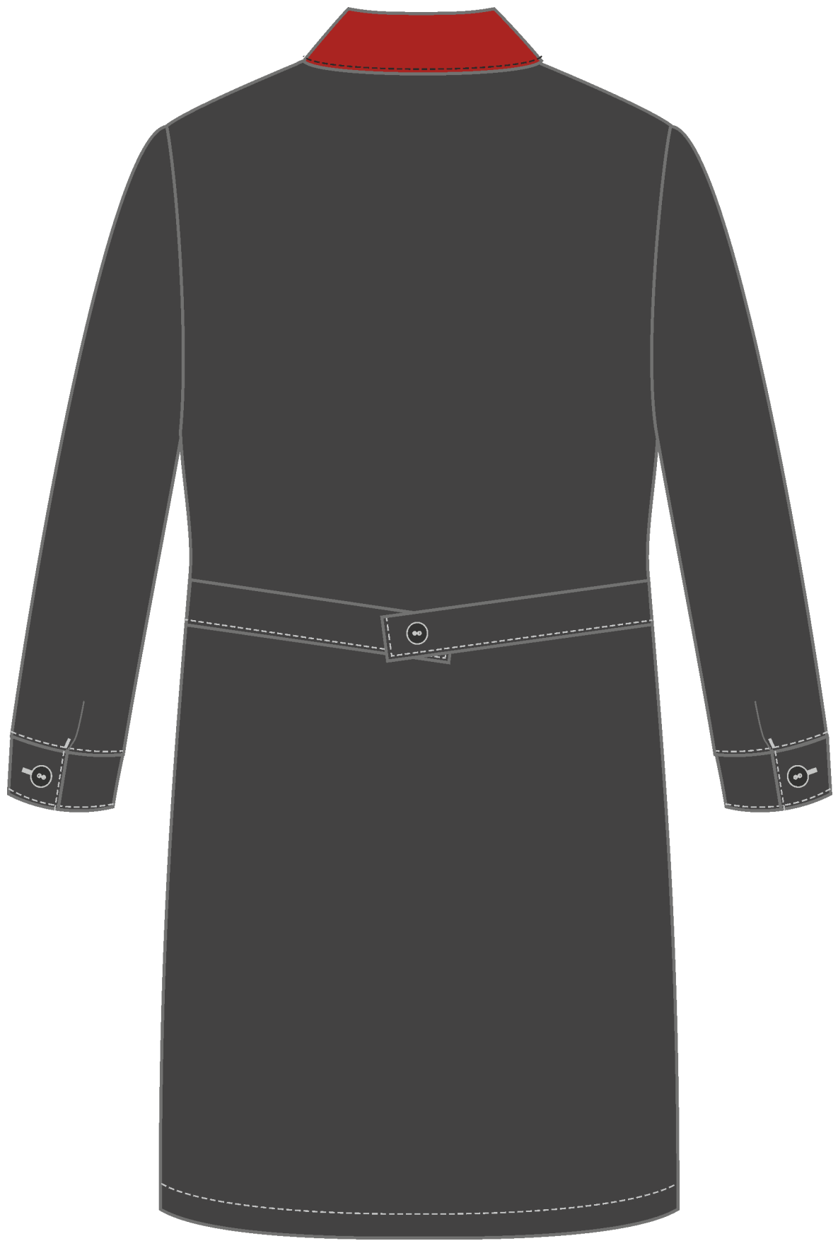
Рис. 2. Эскиз Халат мужской Технолог (тк.Смесовая,210), т.серый/красный, вид сзади.