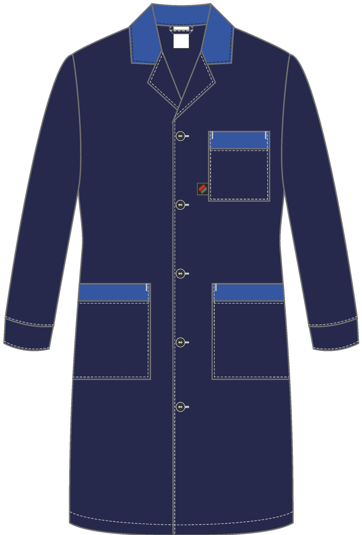
Рис. 3. Эскиз Халат мужской Технолог (тк.Смесовая,210), т.синий/васильковый, вид сзади.