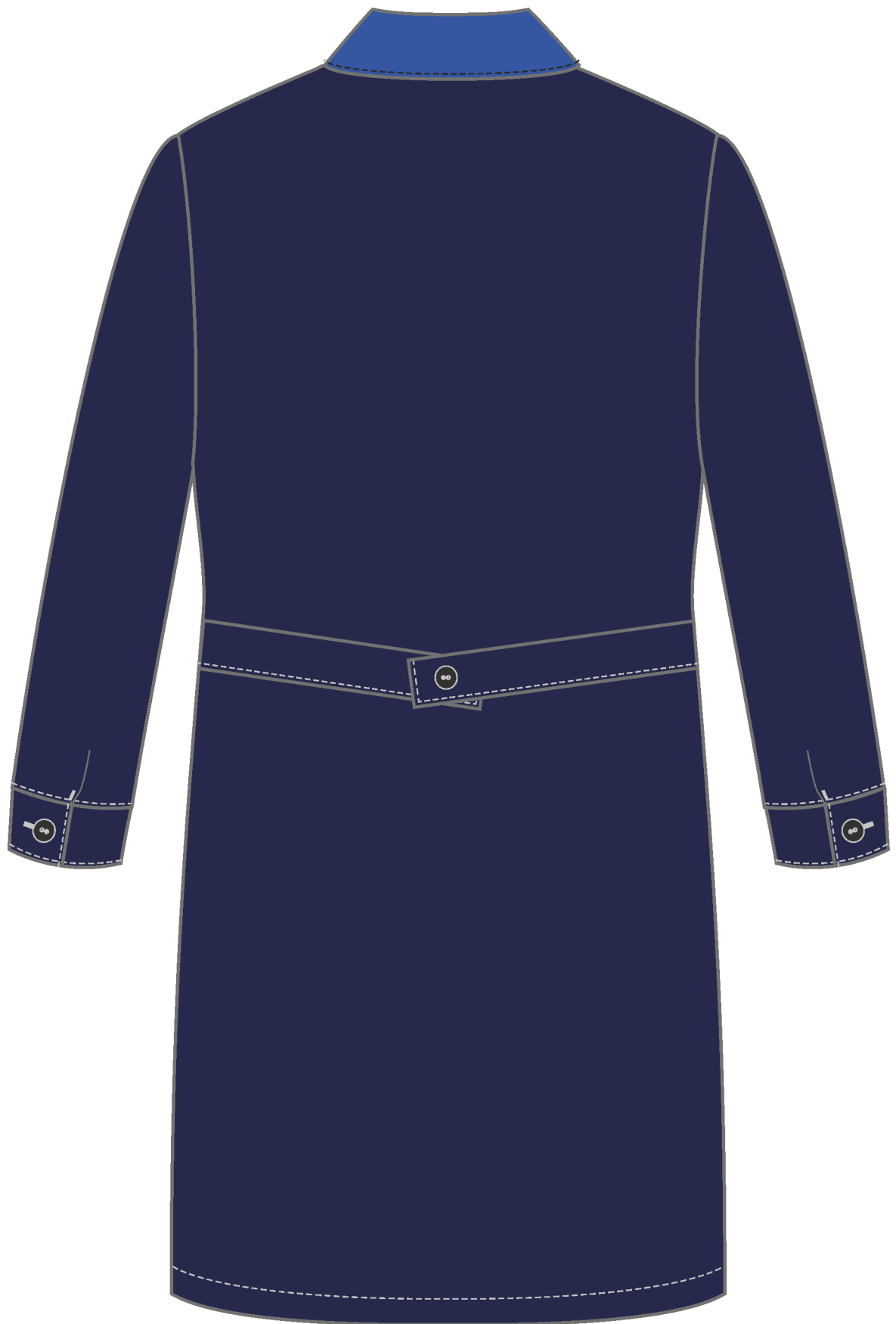
Рис. 3. Эскиз Халат мужской Технолог (тк.Смесовая,210), т.синий/васильковый, вид сзади.