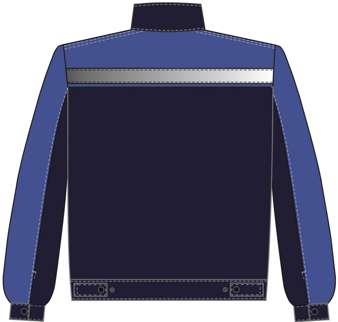
Рис. 2 Костюм Нембус-2 СОП (тк.Смесовая,220) п/к, т.синий/васильковый Куртка вид сзади.