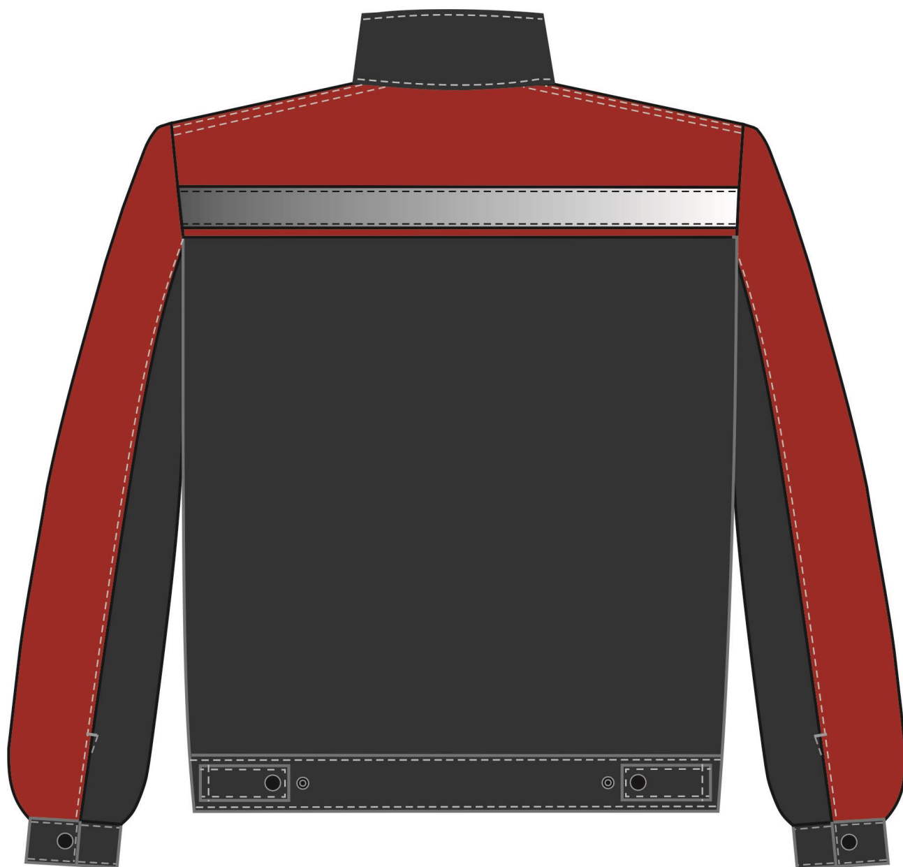
Рис. 5 Костюм Нембус-2 СОП (тк.Смесовая,220) п/к, т.серый/красный Куртка вид сзади.