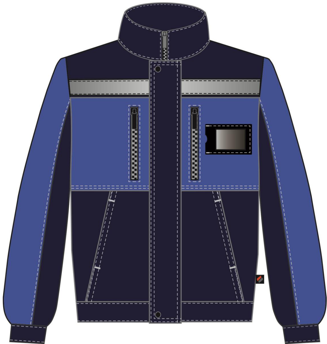
Рис. 1. Костюм Нембус-2 СОП (тк. Смесовая, 220) п/к, т. синий/васильковый Куртка вид спереди.