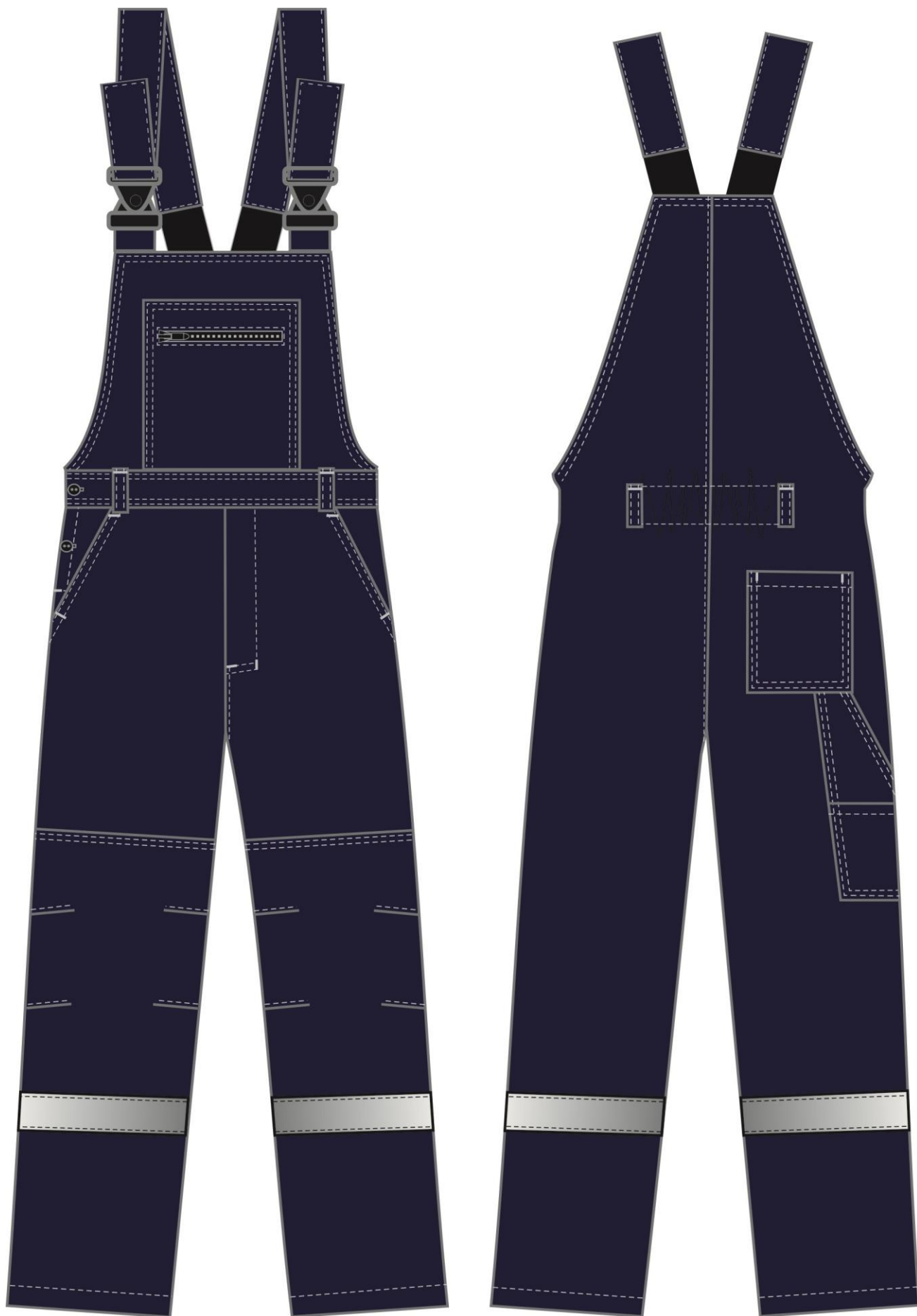
Рис. 3. Костюм Нембус-2 СОП (тк.Смесовая,220) п/к, т.синий/васильковый Полукомбинезон вид спереди и сзади.