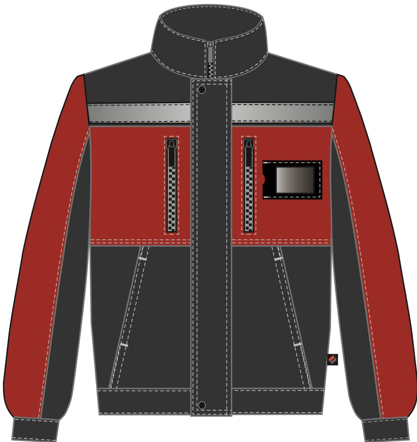
Рис. 4. Костюм Костюм Нембус-2 СОП (тк.Смесовая,220) п/к, т.серый/красный Куртка вид спереди.