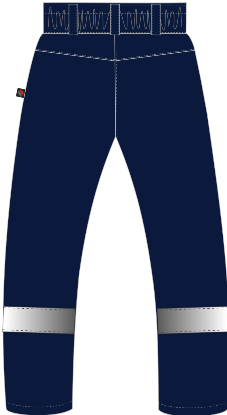
Рис. 2. Эскиз Брюки зимние женские Вьюга СОП (тк.Смесовая,210), т.синий, вид сзади.