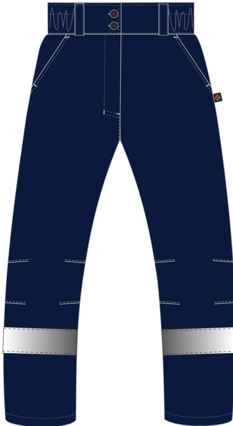
Рис. 1. Эскиз Брюки зимние женские Вьюга СОП (тк.Смесовая,210), т.синий, вид спереди.