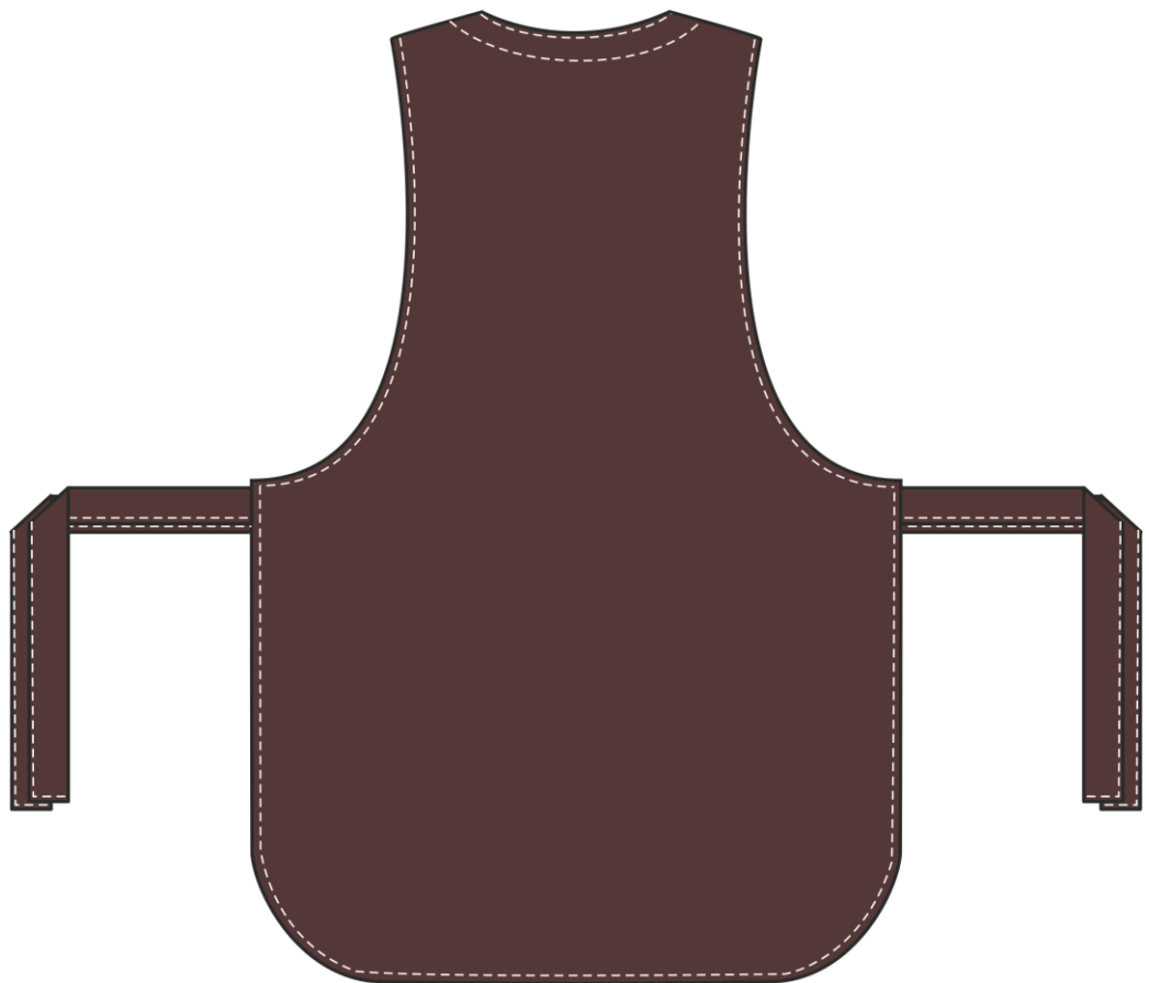
Рис.1. Эскиз Фартук-сарафан Монро (тк.ТиСи), коричневый/бежевый. Вид спереди и сзади.