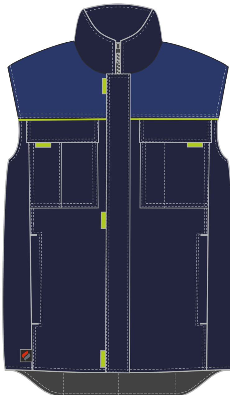
Рис. 3. Эскиз Жилет утепленный Фаворит (тк.Смесовая,210), т.синий/васильковый, вид спереди.