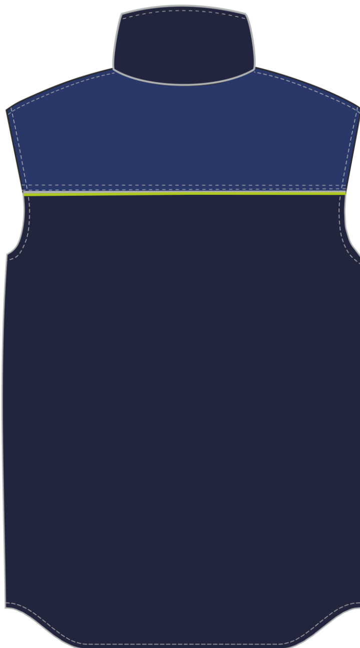
Рис. 4. Эскиз Жилет утепленный Фаворит (тк.Смесовая,210), т.синий/васильковый, вид сзади.