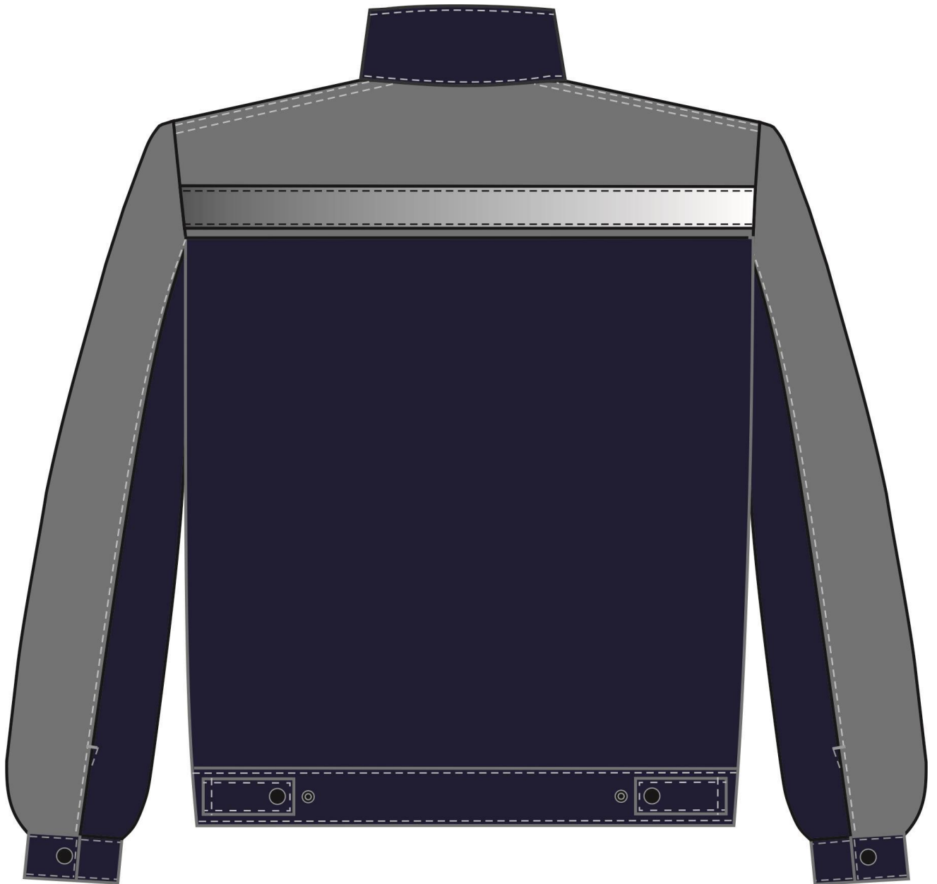
Рис. 5. Костюм Нембус-1 СОП (тк.Смесовая,220) брюки, т.синий/серый Куртка вид сзади.