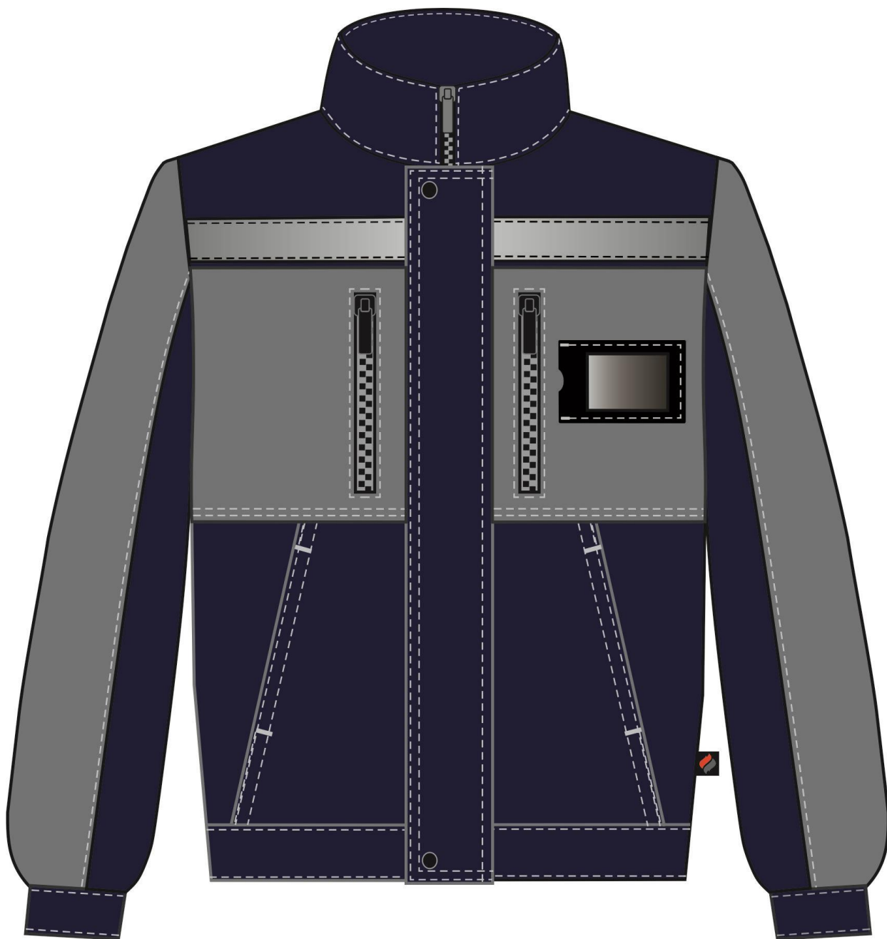
Рис. 4. Костюм Нембус-1 СОП (тк.Смесовая,220) брюки, т.синий/серый Куртка вид спереди.