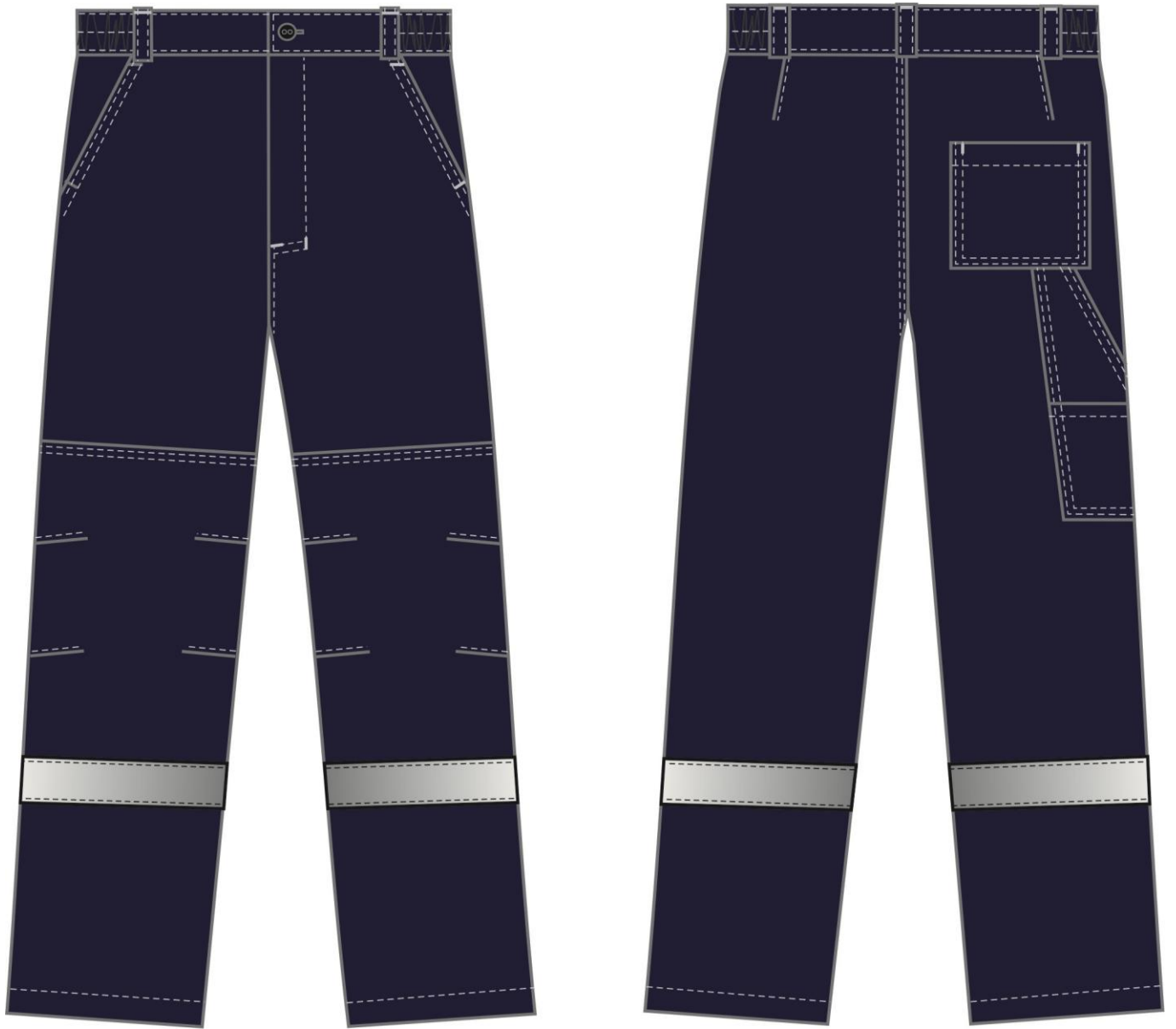
Рис. 6. Костюм Нембус-1 СОП (тк.Смесовая,220) брюки, т.синий/серый Брюки вид спереди и сзади.